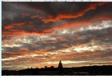
夕映え 茨木市清水地区