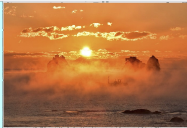
海霧 和歌山県串本