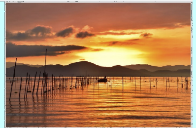
湖上のよあけ 滋賀県 琵琶湖