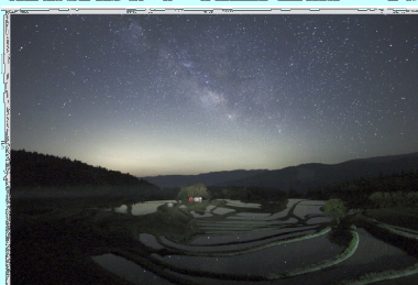
天の川展望 兵庫県 別宮の棚田