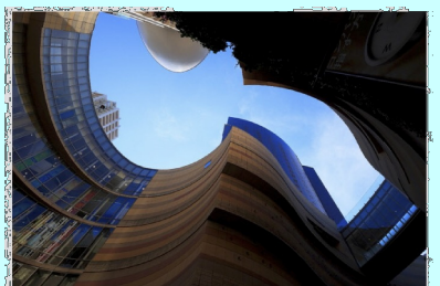
ひすんだ空間 大阪市なんばパークス