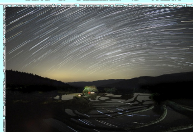
星の軌跡 兵庫県 別宮の棚田