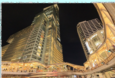
光の塔 大阪市あべのハルカス