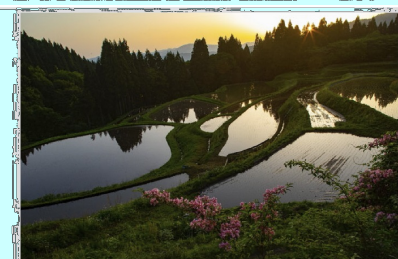
目覚めの棚田 兵庫県 うべ山の棚田