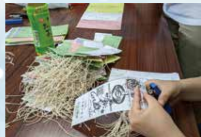
▲タコ糸をホッチキスで留めます