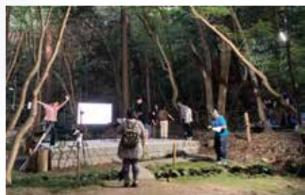
▲現場で配線や機材位置を確認