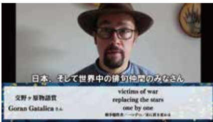
▲ビデオレターで受賞の感想や作品に込めた想いをお話いただきました。