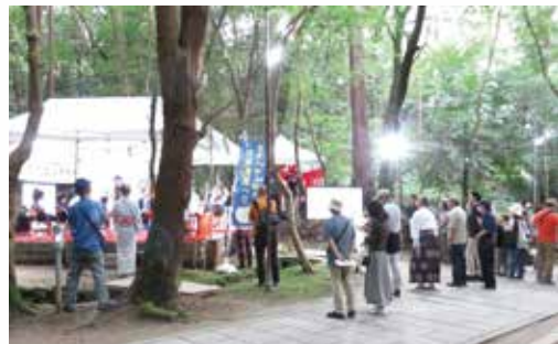
▲表彰式会場の石舞台前では多くの方が観覧されていました