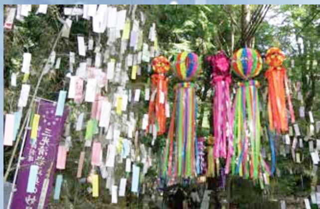
▲星田妙見宮参道にはいたるところに大きな吹き流しとたくさんの俳句が飾られておりとても壮観です