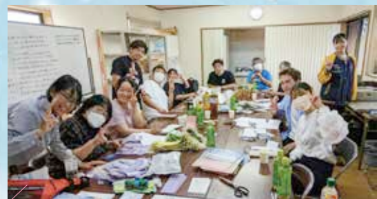
▲13名がかりで約4時間かかってこの日の分が完了！