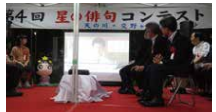
▶壇上中央の画面に受賞者のビデオレターや作品を投影。