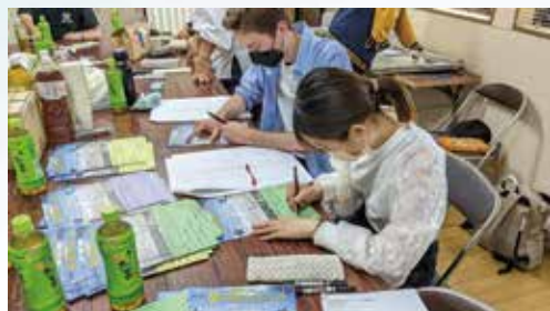
▲ひまわりさんが英語俳句を丁寧に記入

夏石先生の審査が終わった俳句は、すべて星田神社に集められます。データとして保管するため、まずは作品一枚の写真撮影してから名前や住所欄を切り離し、短冊のみの状態にします。その後、星田妙見宮の境内の笹に飾るため、実行委員メンバーの手でひとつひとつ紐付けをしていきます。海外から応募のあった英語俳句は、関西外国語大学のボランティアサークル「ひまわり」の学生さんにお手伝いいただき、150通を手書きしていただきました。