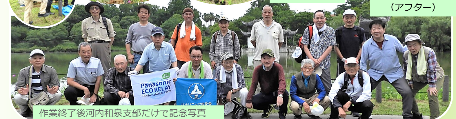
作業終了後河内和泉支部だけで記念写真