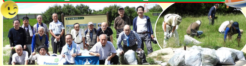
参加された皆さん(工工汗かきました)