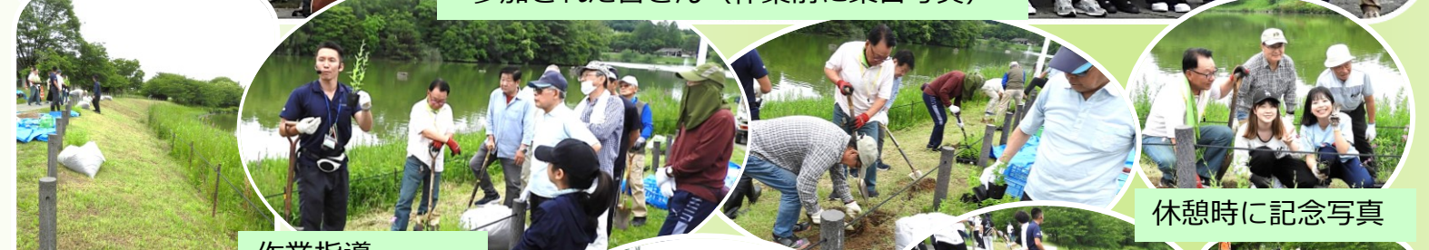
作業指導 花の苗植え付け