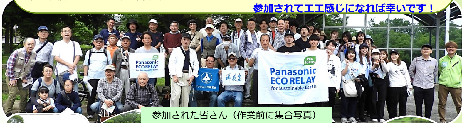
参加された皆さん（作業前に集合写真）