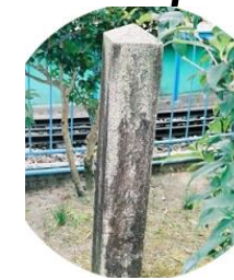
法勝寺八角九重の塔跡