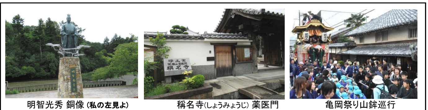
明智光秀 銅像(私の左見よ)