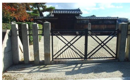
後白河天皇法住寺陵