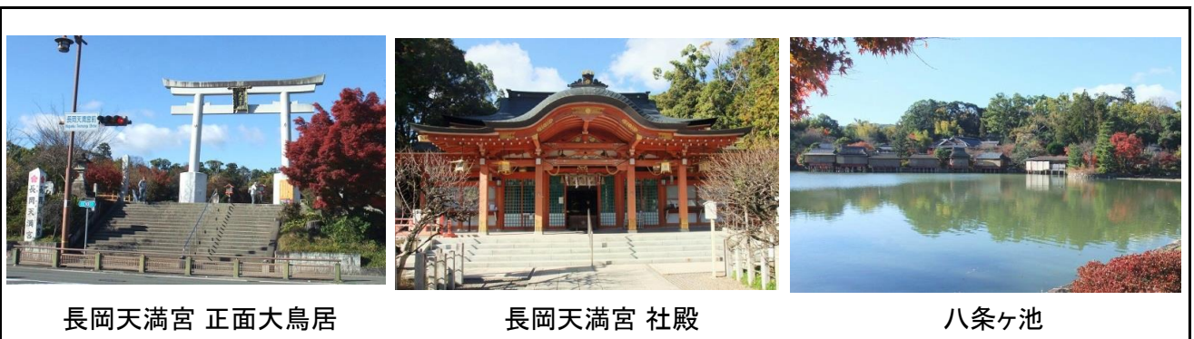
長岡天満宮 正面大鳥居