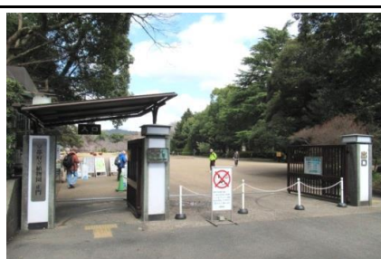
京都府立植物園正門