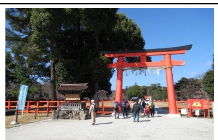
上賀茂神社一の鳥居