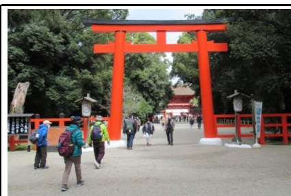
下鴨神社二の鳥居