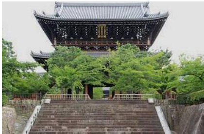
黒谷金戒光明寺山門