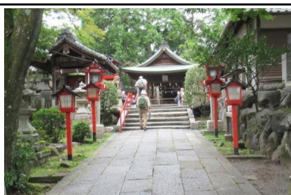
三宅八幡宮・本殿