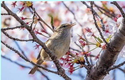
洛西竹林公園でさえずるウグイス