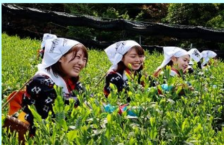
宇治八十八夜茶摘み