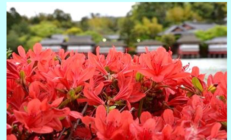
長岡天満宮のキリシマツツジ