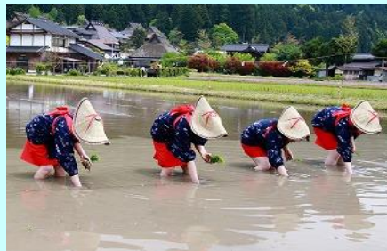
美山かやぶきの里お田植祭