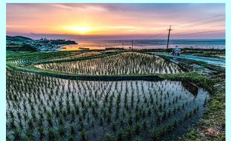
京丹后市袖志の棚田