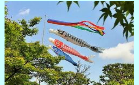
向日市法性山石塔寺のこいのぼり