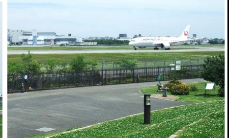
伊丹スカイパーク・JAL旅客機離陸