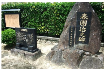
受楽寺・春團治の碑