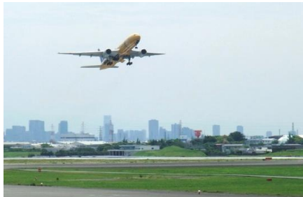
下河原緑地・大型貨物機離陸