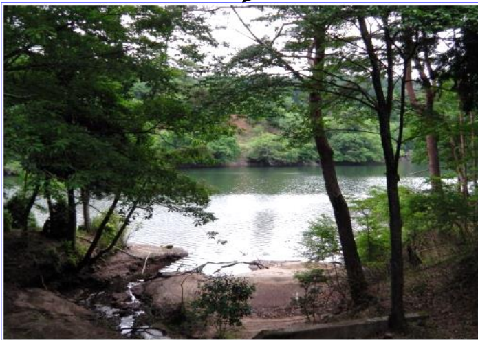
写真 17 / 26 大阪市の野外活動センター内を通りぬけて田代湖に出ました。野外活動セ