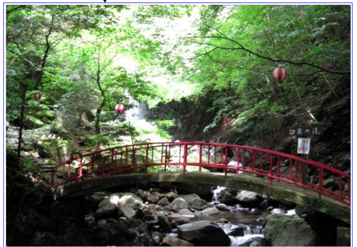
WC：霊山寺と白藤滝にあり