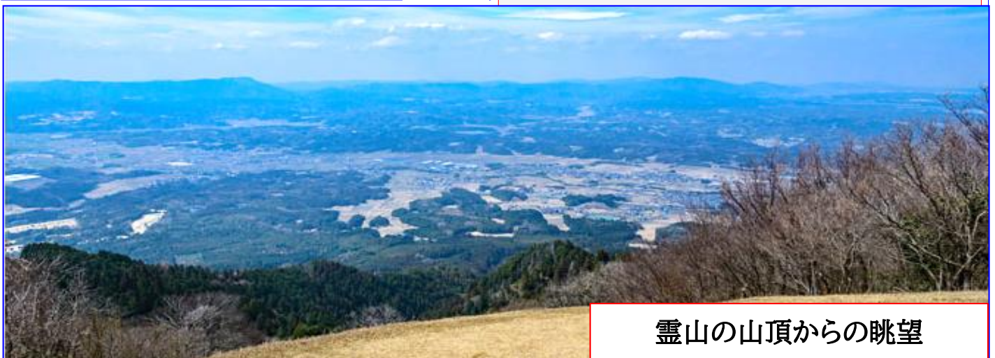
霊山の山頂からの眺望