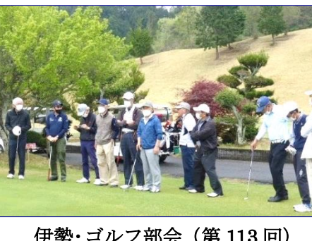
伊勢・ゴルフ部会 (第113回)