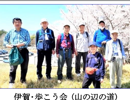
伊賀・歩こう会 (山の辺の道)