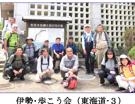
伊勢・歩こう会 (東海道-3)