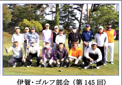
伊賀・ゴルフ部会 (第145回)