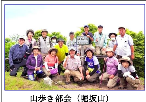
山歩き部会 (堀坂山)