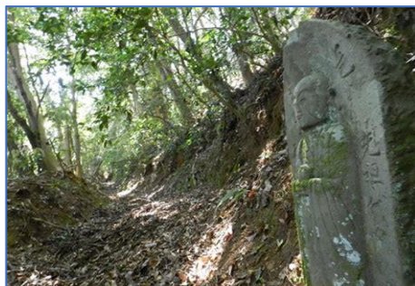
&lt; 地藏丁石 &gt;