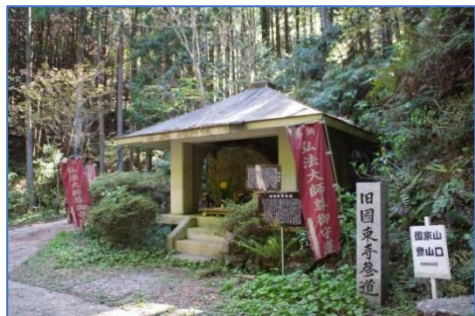
&lt; 弘法石:国東山・登山口 &gt;

道中には弘法大師を崇めてまつられた巨石の弘法石や、水が多い時には雨どいのように水が流れると石、国東寺跡までの距離を記したお地藏様の無現童女、見晴らしスポットなどがあり、山頂付近には、かつて修行場として栄えた国東寺跡があります。 ※コースは、2020年の実施時と同じです！