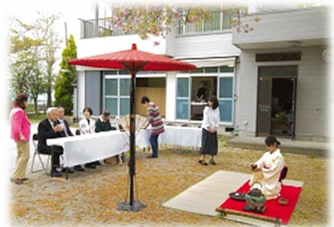
以前の桜茶会・開催のもよう