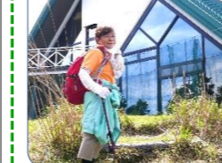
青山高原・山歩き

一方、主人の登山・カラオケ、孫の白球・絵や字にも興味を持ち、自分は卓球に励み、そして、学生時代に戻った気分で「茶の実会」の創設へ!