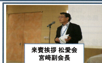
来賓挨拶 松愛会 宮崎副会長