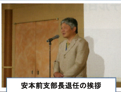
安本前支部長退任の挨拶