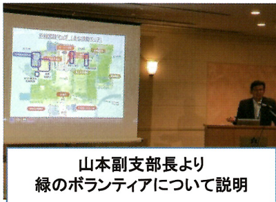
山本副支部長より 緑のボランティアについて説明