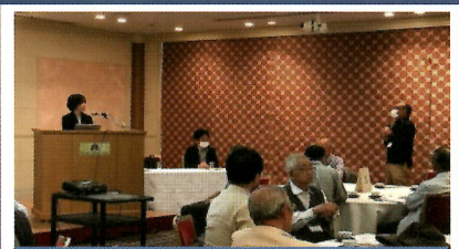
『長寿社会と介護保険』についての質疑風景