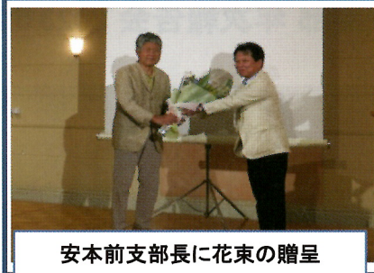
安本前支部長に花束の贈呈