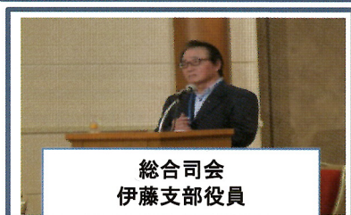
総合司会 伊藤支部役員