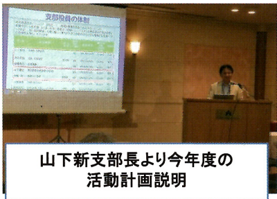
山下新支部長より今年度の活動計画説明