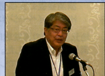
産業雇用安定センター / 祝所長