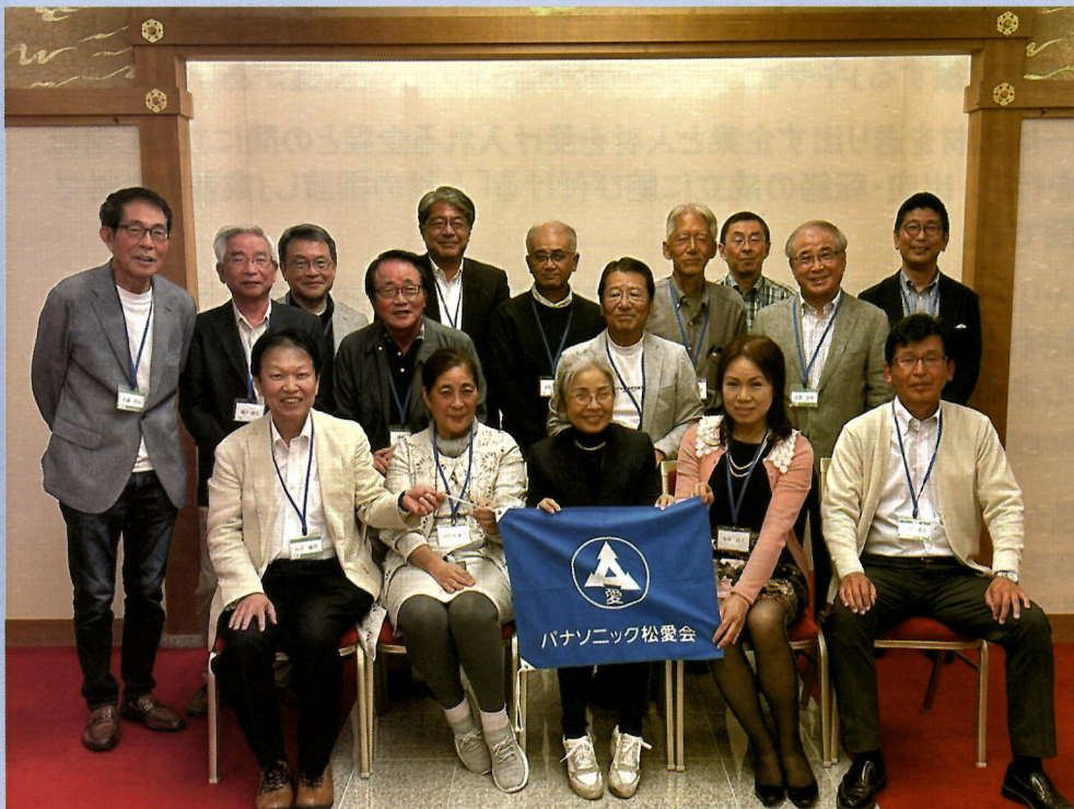
参加された会員の皆さんと役員の記念写真