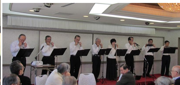
ハーモニカ同好会による演奏