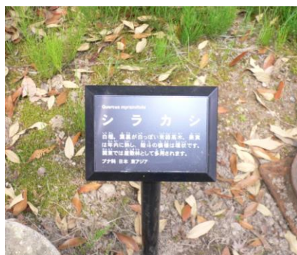
樹木名のプレート設置