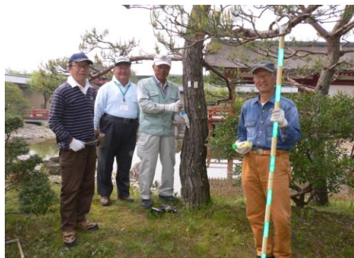
松枯れ防止剤の樹幹注入