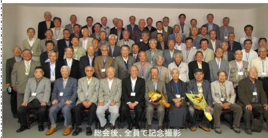
総会後、全員で記念撮影