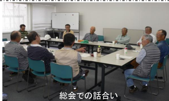
総会での話し合い