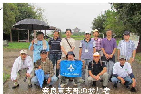
奈良東支部の参加者