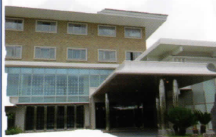
於: ホテルリガーレ春日野

平素は、パナソニック松愛会 奈良東支部の活動に ご支援、ご協力いただきまして心よりお礼申し上げます。 さて、去る5月19日(土) 奈良東支部の年次支部総会は、ホテルリガーレ春日野にて58名のご参加をいただき開催、議案について満場一致でご承認いただきました。また、アトラクションや諸行事についても盛況裡のうちに進行することができ、有意義な楽しいひと時を過ごすことができましたのでその一端を報告させていただきます。