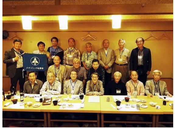
2018年5月19日 和歌山報告会