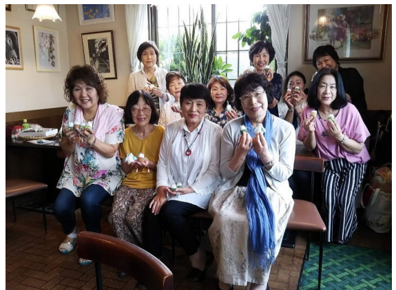
2018年7月28日 奈和女子会かがやき