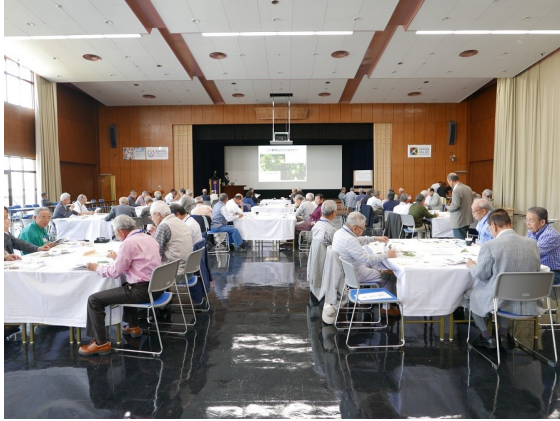
2018年5月12日 奈和支部総会