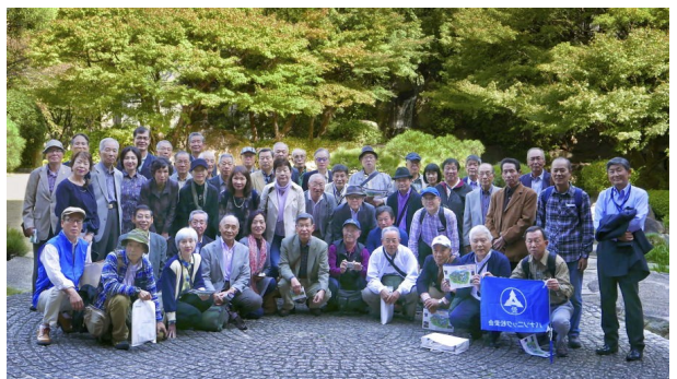
2018年10月25日 社会見学会 「パナソニック」ミュージアム 太閤園