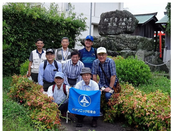
2018年6月21日 創業者足跡ウォーキング