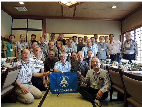
2018年6月23日 節目懇談会