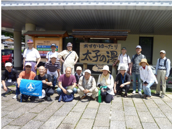
2018年6月13日 明日香村ウォーキング