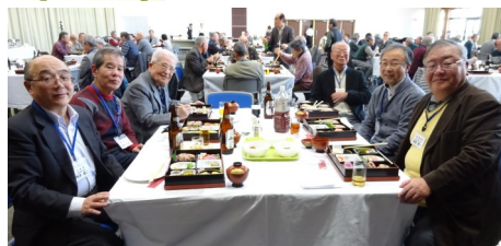
2019年1月19日 奈和支部 新春懇親会