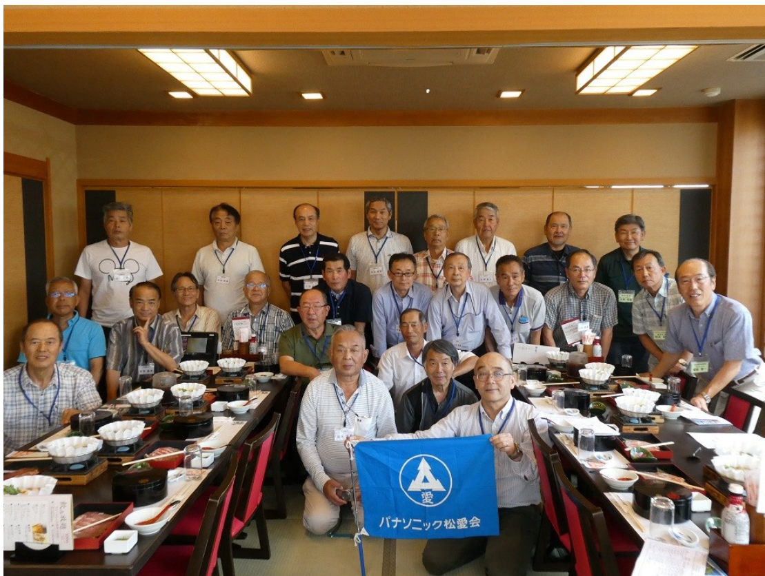
参加者全員 記念撮影

内 容：第1部 記念撮影 支部活動報告 第2部 昼食 懇親会 自己紹介 皆さん同年代・同期生ということで大変盛り上がり喜んで頂きました。