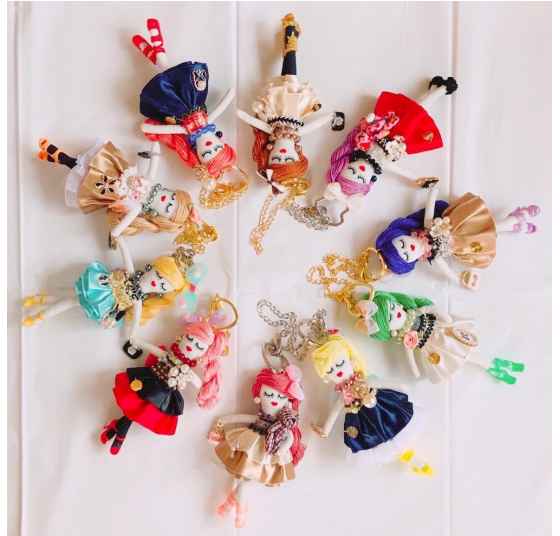
作品のバックチャーム