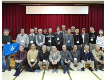
宇陀市・桜井市・宇陀郡・山辺郡