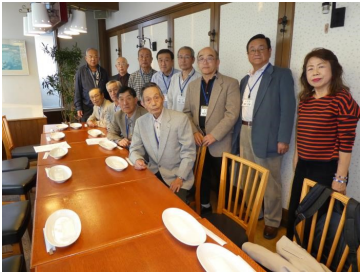
橿原市・大和高田市・周辺地域

日時・開催場所等は、次回10月号支部報でご案内いたします。会費は当日、現地で徴収致します。 2019年度新入会員は会費無料です 下記は2018年度地域別懇談会 各地での開催写真です