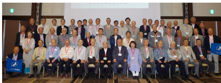
(参考) 2023年度 支部大会