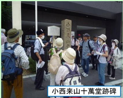
小西来山十萬堂跡碑