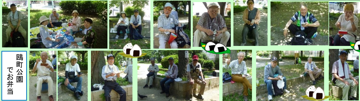
鵜町公園 でお弁当