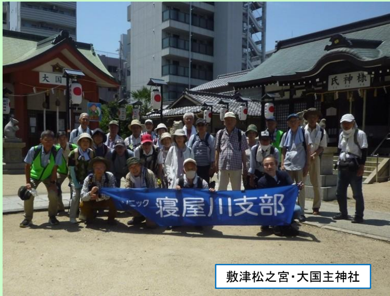
敷津松之宮・大国主神社

まだ6月の中旬というのに35度に迫る猛暑の中での散歩となりました。今回は大阪ミナミ周辺のディープ一角から外国の観光客の方が多いジャンジャン横丁、大阪のシンボル「通天閣」を抜けるなど不思議な散歩で全員が完歩できました。