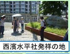
西濱水平社発祥の地