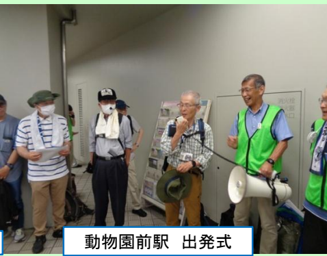
動物園前駅 出発式