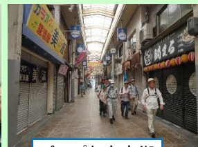
ディープな商店街