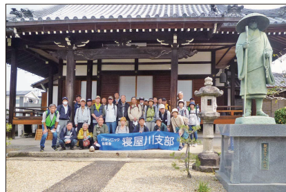
[天通山 西念寺にて]

緑地に到着しました。そこで早めの昼食をとりながら、早咲きの桜を少しだけ楽しみました。そこから、JR河内磐船駅を越えてその先の「大門酒造」を横に見ながら、高