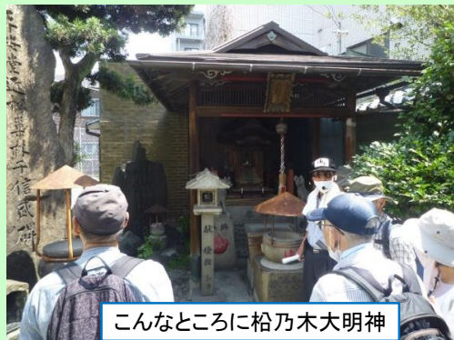
こんなところに松乃木大明神

動物園前駅南改札(集合/出発式)⇒松乃木大明神⇒(通天閣)⇒小西来山十萬堂跡碑⇒今宮戎神社(集合写真)⇒徳風学校跡⇒広田神社・赤土稲荷大明神⇒難波八坂神社⇒鵜町公園(昼食)⇒敷津松之宮・大国主神社(集合写真)⇒唯専寺・願泉字寺⇒有隣学校跡⇒西濱水平社発祥の地⇒浪速玉姫公園(解散式)⇒JR環状線芦原橋駅