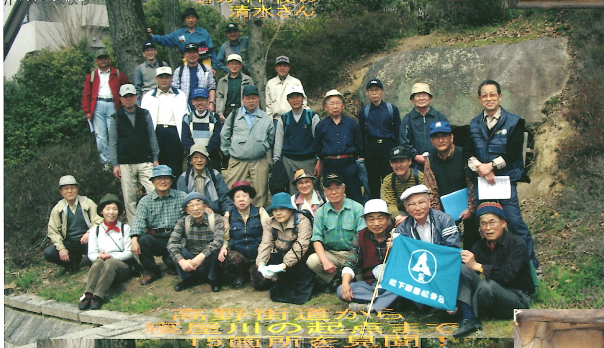
高野街道から寝屋川の起原まで15箇所を見聞！