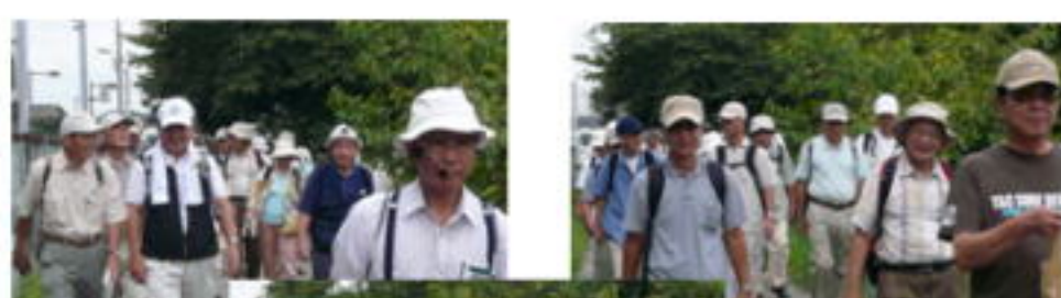
参加者48名 スタート直後 まだまだ元気