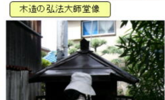
大師堂(大東から移座された)