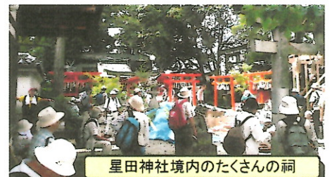
星田神社境内のたくさんの祠