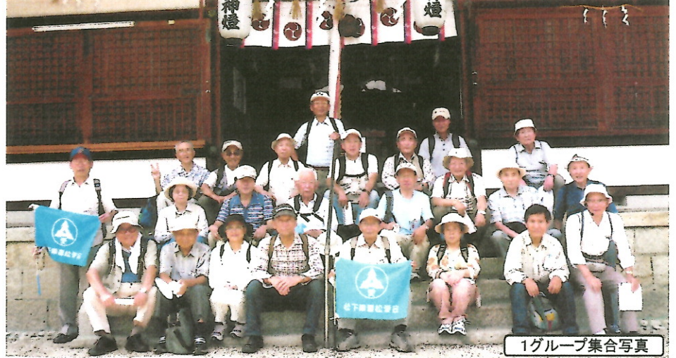
1グループ集合写真