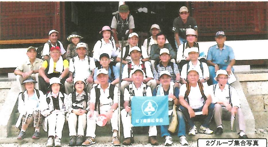
2グループ集合写真