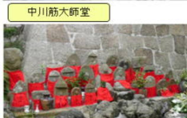
善林寺境内の石像群