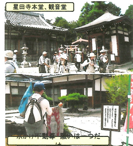
水かけ不動尊 願いはーらだ