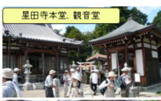
星田寺本堂、観音堂