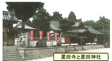
星田寺と星田神社