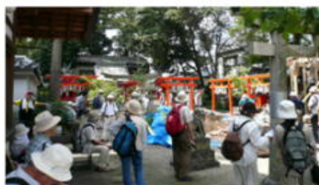
星田神社境内のたくさんの祠