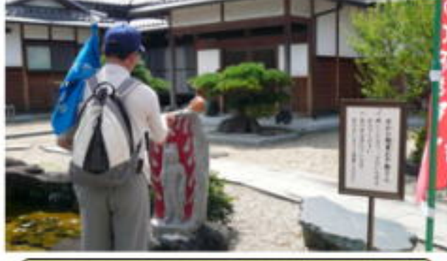
水かけ不動尊 願いは一つだけ