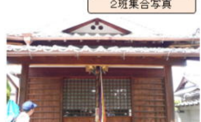
光明寺隣の薬師堂