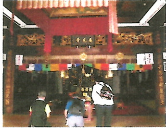
河内西国23番札所慈光寺本堂