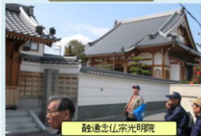
融通念仏宗光明院