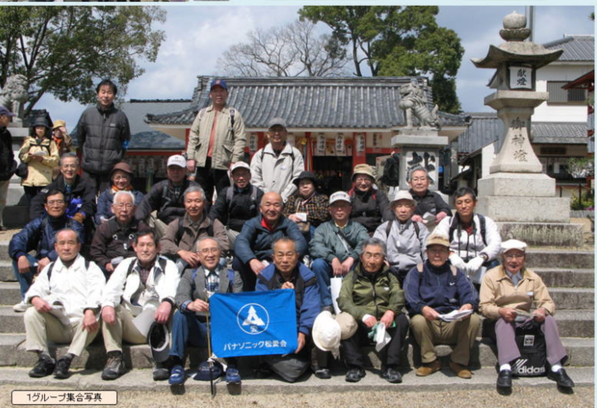
1グループ集合写真