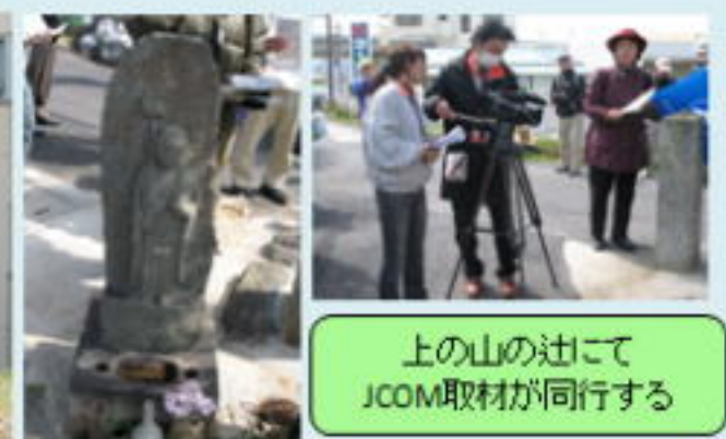
上の山の辺にて JCOM取材が同行する