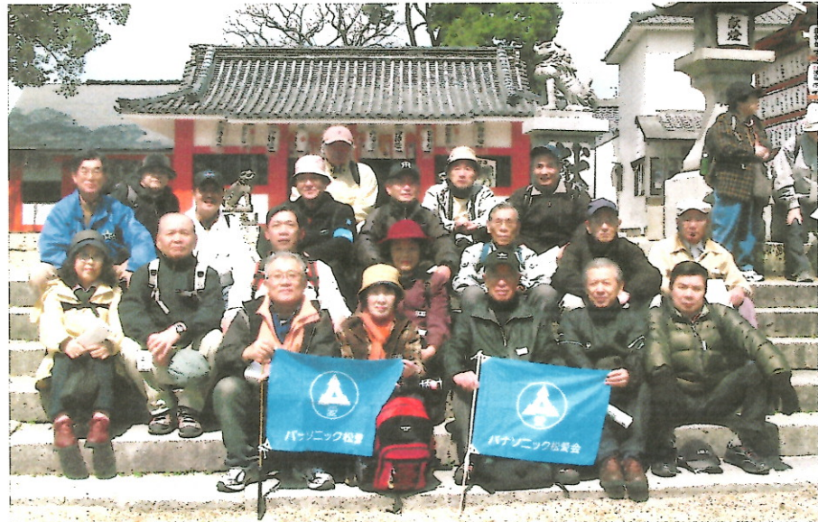
2グループ集合写真