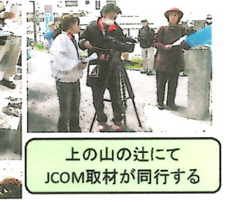
上の山の辻にて JCOM取材が同行する