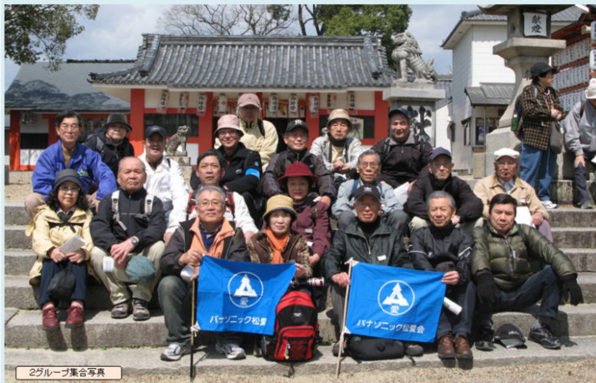
2グループ集合写真