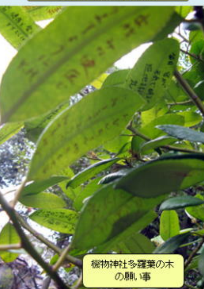
機物神社多羅葉の木の肌い事

今回の史跡巡りに「北河内ケーブルネット」の取材が入り最初から最後まで行程を同行取材されました。番組は「週刊河内ニュース」の中で放映されました。放映期間は3月28日～4月3日の1日3～4回放映され見た方もたくさん居られると思います。