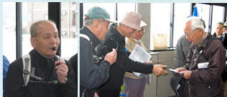
中西副支部長挨拶