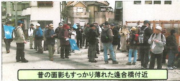
昔の面影もすっかり薄れた逢合橋付近