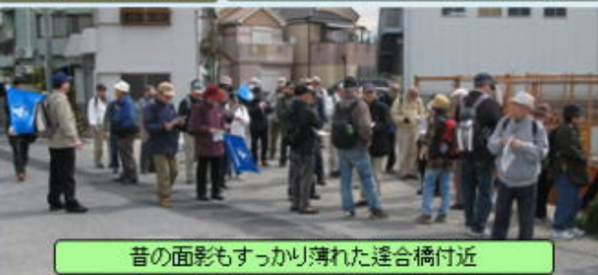
昔の面影もすっかり薄れた逢合橋付近