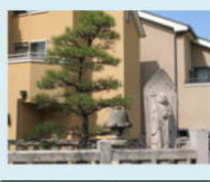
本尊掛松と法明上人碑