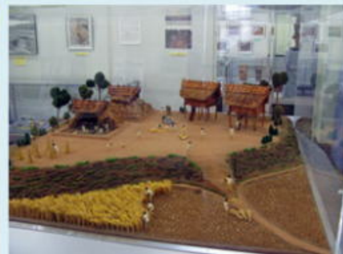
交野市教育文化会館展示