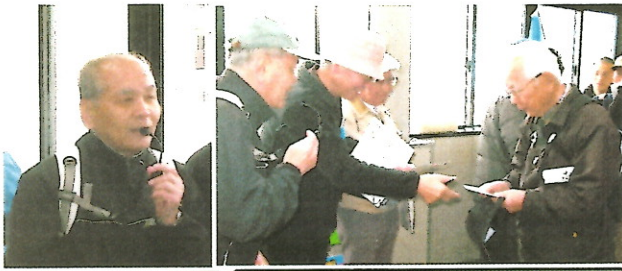
中西副支部長挨拶