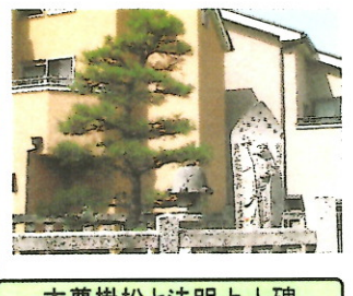
本尊掛松と法明上人碑