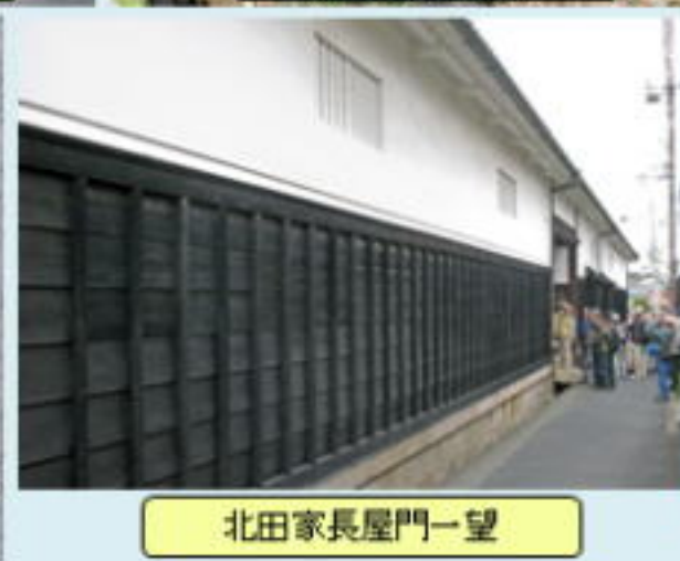
北田家長屋門一望