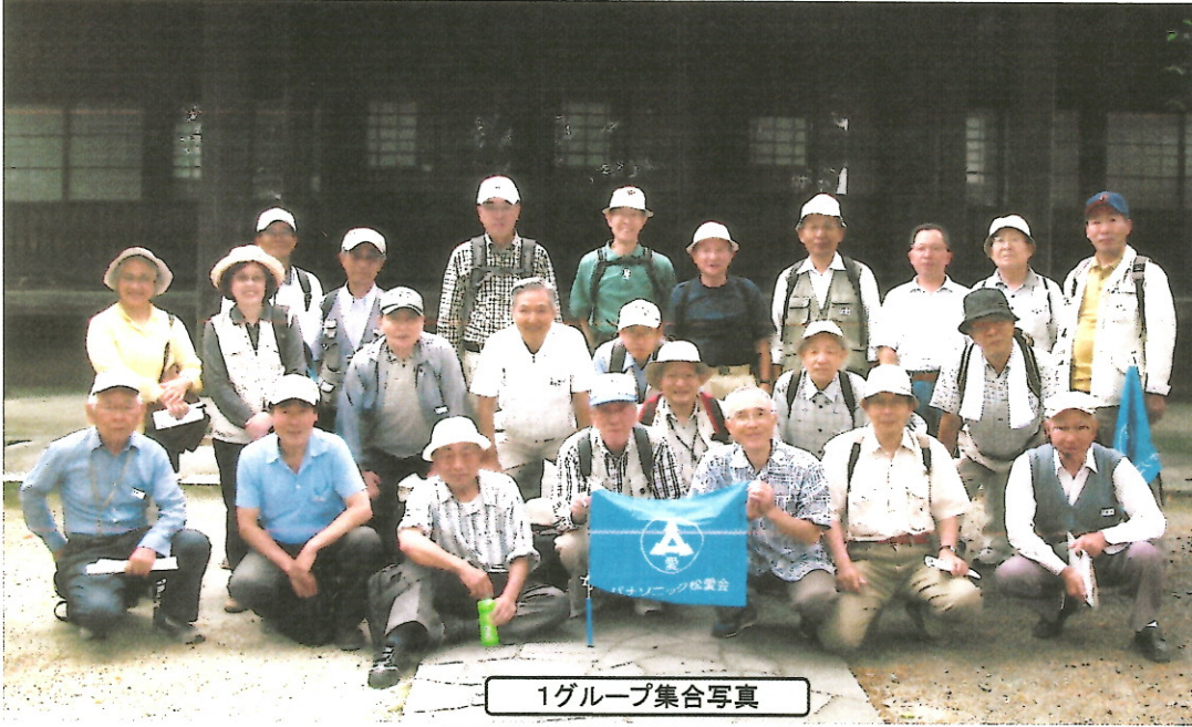
1グループ集合写真