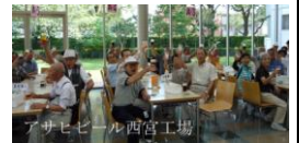
最高の盛り上がり で乾杯をしました

園内は花の手入れも行き届いており、職員の苦勞を感じた。昼食はきれいに咲き誇る花の下で、バイキング料理を堪能、満足し花鳥園を後にした。昼からは湊川神社に向かい、ご祭神である楠木正成公について宮司さんからお話を聞き大楠公の理解が深まった。その後西宮に移動十日えびすや開門福男選びで有名な西宮神社をお参りした。最後は全員が楽しみにしていたアサヒビール西宮工場の見学と試飲を楽ししみ、心地よい眠りの中無事に帰着した。