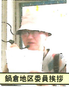
鍋倉地区委員挨拶