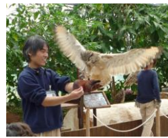
フクロウショー を楽しみました

バス2台で出発、阪神高速湾岸線を神戸に向い渋滞もなくポートアイランドにある神戸花鳥園に到着した。フクロウやミミズク、また沢山の鳥たちのショーや色鮮やかさに感激をした。