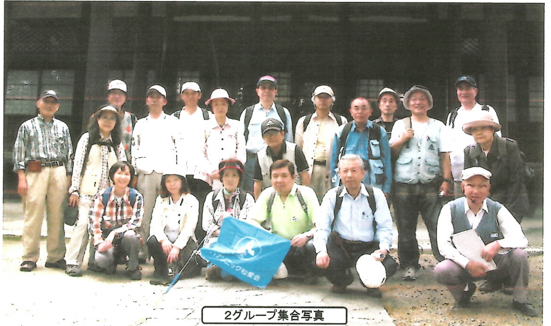
2グループ集合写真