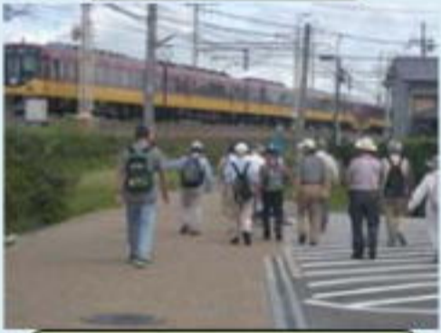
京阪電車沿いの移動