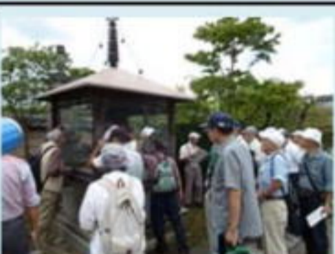
久修園院トイレの神様