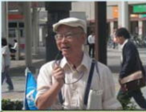
清水解説員の解説で開始