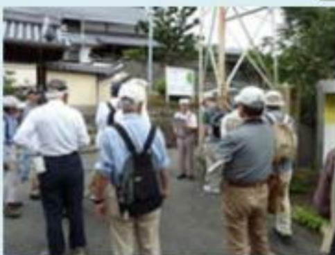
湯沢山茶久蓮寺石碑前