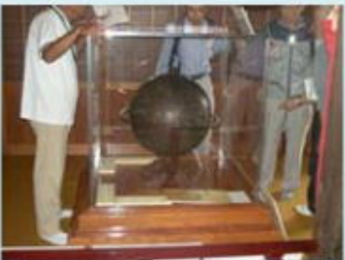
元禄期製作の天球儀