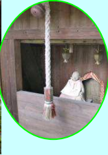
明光寺と境内にある雷神石・首なし地蔵