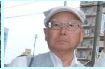
清水さんお世話になりま