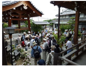
極楽寺での釣鐘解説

今回は寝屋川市内パート2のコースを三地域に分けて合計12箇所の史跡巡りとなった。初めは駅東部に広がる丘陵地方面、次に駅周辺部、最後に駅北東部方面の田植え直後の田圃の畦道を抜け駅北側の寝屋川公園内まで、約5kmの歴史散策となった。