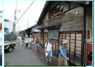
東寝屋川駅を出発