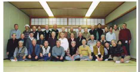
松愛会近畿麻雀部の皆さん

10 人とあいさつをする」にあると仰っておられます。結果として麻雀やクラブの人達との繋がりが大きくなり、活動の場が広がり生活の潤いが生まれていると感じました。