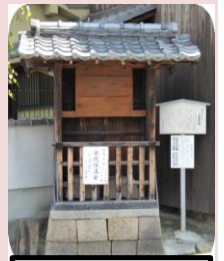
下田部高札場と道標