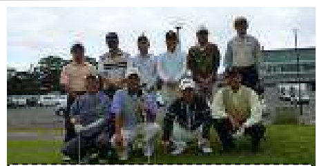
ゴルフ同好会の皆さん