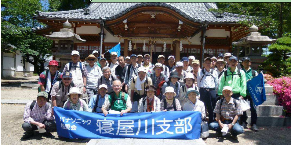
野見神社・永井神社にて