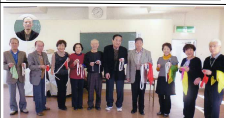
マジック同好会の皆さん

松愛会に登録されている、マジック同好会は平成 15 年に 4 名で発足し、現在は 12 名が月 1 回練習に励んで腕を磨いております。