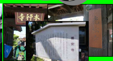
寺町(本行寺・光松寺・理安寺)