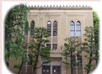
イスラム様式アーチ