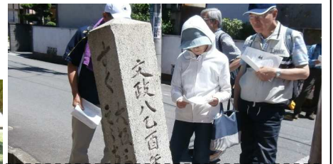
前島口(一丁田口)道標

た文字を読み取ることで、歴史の重厚感や昔日の旅人の苦労が分かる史跡シリーズとなりました。