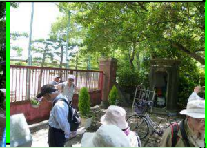
旧陸軍工兵隊哨兵所跡