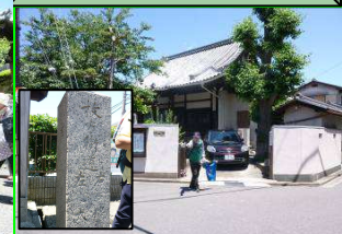
是三寺と大塚口道標