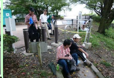
河川公園背割堤で昼食