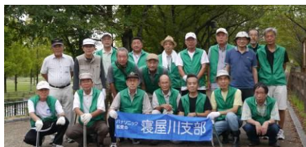
打上治水緑地公園参加の皆さん

小雨交じりでしたが10月3日(月)市内4公園にて清掃活動を実施し39名の参加を戴きました。