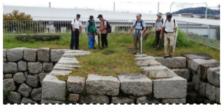
淀城天守跡石垣上を見学

第143回街道シリーズは9月29日(木)京阪電車淀駅中央改札前に11名が参加、開催されました。当日8時過ぎのゲリラ豪雨の影響で自宅での出発準備の出鼻を挫かれた方が多く、近年にない少人数の参加者数となりました。