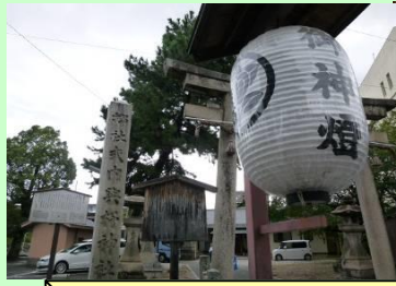
與杼神社では宮司から謂れを説明いただきました