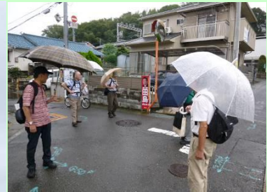
橋本駅付近を經由