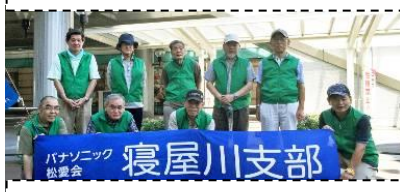
寝屋川市駅参加の皆さん