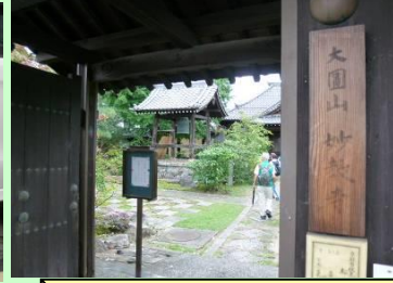
妙教寺ではご住職から謂れを説明いただきました