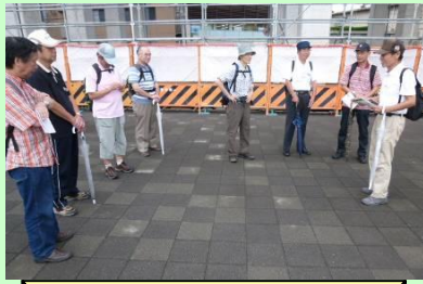
小雨の中11名でスタート