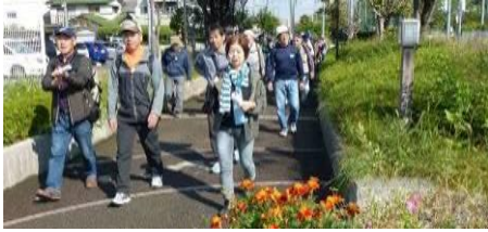
京阪電車西三荘駅に集合、夜半の雨で

本年も健康フェスティバル行事として、11月1日(火)にウォーキング&バーベキュー大会を開催し41名の方に参加いただきました。