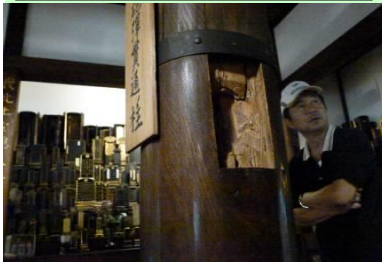
妙教寺本堂柱の戊辰戦争砲弾貫通跡と保管の砲弾