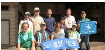
萱島駅参加の皆さん

市内4駅前清掃活動は、9月4日(日)に実施され、蒸し暑い中でしたがご家族4名、初参加会員4名を含む44名の参加を戴きました。本号では萱島駅寝屋川駅参加の皆さんを掲載します。