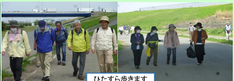
ひたすら歩きます