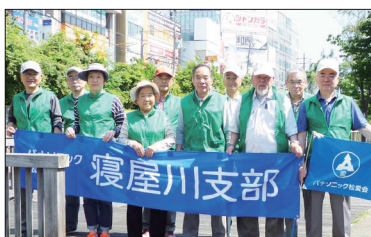
[寝屋川市駅参加の皆さん]

また、6月3日(日)に市内4駅の駅前清掃が実施されました。当支部からは、4駅で51名の参加をいただきました。ご協力ありがとうございました。