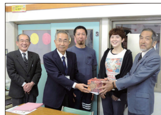
[あかつき・ひばり園にて]

支部及び他支部会員並びに地域の皆様のご協力により2017年度に収集させていただきましたプルタブ総重量が158kgとなり換金額が14,540円となりました。又行事開催毎に設置しています「ちょこっと募金箱」にご協力いただきました浄財が40,146円となり、合計で54,686円になりました。ご協力に感謝申し上げます。