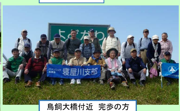
鳥飼大橋付近 完歩の方

まだ残る桜の余韻を楽しみ、春の訪れを感じながら、『ともろぎ二神社』等の寝屋川史と京街道ウォーキングを楽しみました。