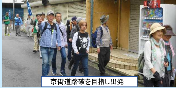
京街道踏破を目指し出発