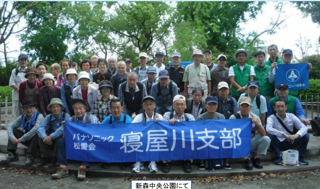
新森中央公園にて