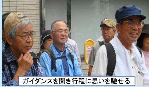
ガイダンスを聞き行程に思いを馳せる