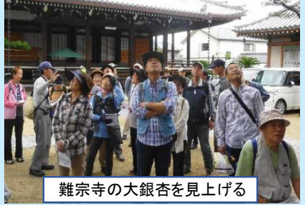
難宗寺の大銀杏を見上げる