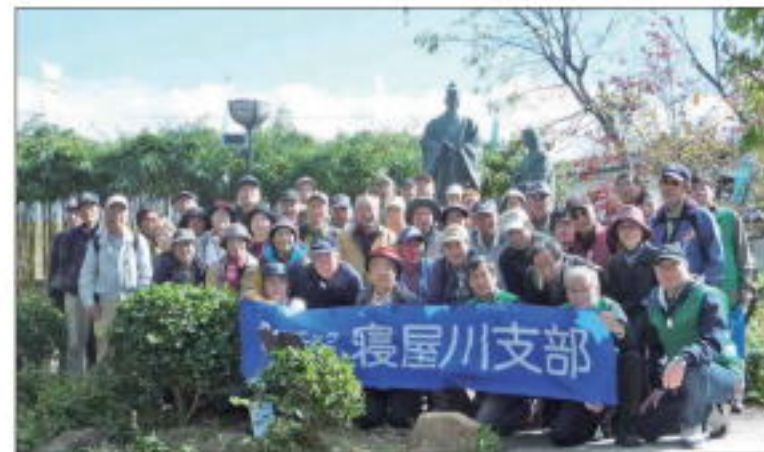
【勝龍寺城公園 ガラシャ像前にて】

まずは長岡京発見の地を訪ねた後、江戸時代の庶民信仰の対象になった六地藏・五王像がある神足石仏群を巡り、西国街道を南下し国の登録有形文化財で江戸時代の町家石田家に立ち寄りしました。その後、勝龍寺城の北端になる空堀を巡り、神足神社を訪ねた後、今回のハイライト明智光秀ゆかりの山城国勝龍寺城公園で昼食を摂りました。午後からは勝龍寺、春日神社、勝龍寺城大門跡と恵解山古墳を訪ね歩いた後、中山修一記念館、西光寺、明智光秀本陣跡を経て、阪急西山天王山駅にて散会しました。