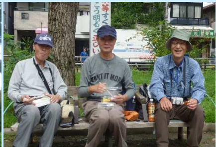
楽しい昼食タイム