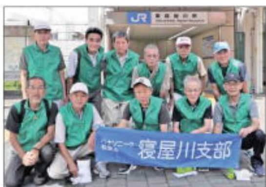
【JR東寝屋川市駅参加の皆さん】