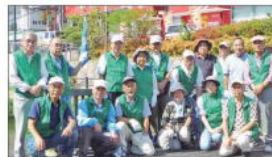
【寝屋川市駅参加の皆さん】

市駅で17名、萱島駅で9名、JR東寝屋川駅で11名の計51名の方々のご参加をいただきました。ご協力いただいた皆様に御礼申