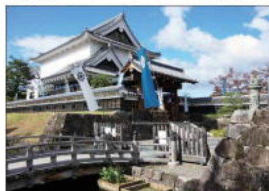
【勝龍寺城公園管理棟】

まずは長岡京発見の地を訪ねた後、江戸時代の庶民信仰の対象になった六地藏・五王像がある神足石仏群を巡り、西国街道を南下し国の登録有形文化財で江戸時代の町家石田家に立ち寄りしました。その後、勝龍寺城の北端になる空堀を巡り、神足神社を訪ねた後、今回のハイライト明智光秀ゆかりの山城国勝龍寺城公園で昼食を摂りました。午後からは勝龍寺、春日神社、勝龍寺城大門跡と恵解山古墳を訪ね歩いた後、中山修一記念館、西光寺、明智光秀本陣跡を経て、阪急西山天王山駅にて散会しました。