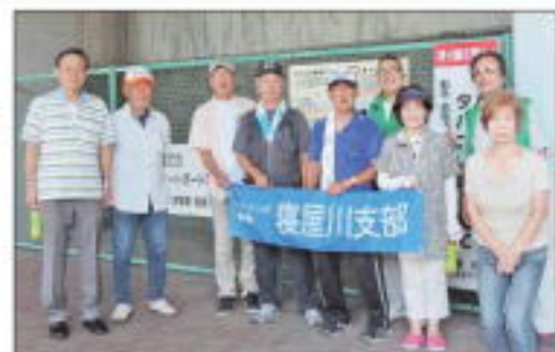
【萱島駅参加の皆さん】