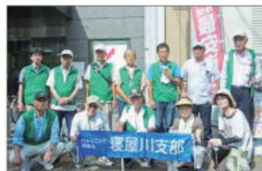
【香里園駅参加の皆さん】

し上げます。なお、駅前清掃活動は、寝屋川市の方針により、12月の活動を取り止め、今後は3月、6月、9月の年3回開催となります。