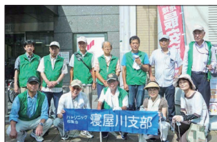
[香里園駅参加の皆さん]

し上げます。なお、駅前清掃活動は、寝屋川市の方針により、12月の活動を取り止め、今後は3月、6月、9月の年3回開催となります。