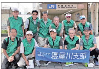
[JR東寝屋川市駅参加の皆さん]