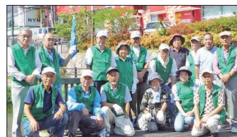
[寝屋川市駅参加の皆さん]

市駅で17名、萱島駅で9名、JR東寝屋川駅で11名の計51名の方々のご参加をいただきました。ご協力いただいた皆様に御礼申