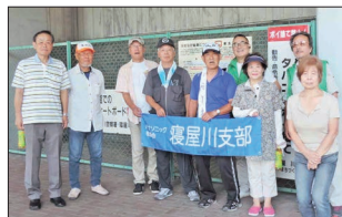
[萱島駅参加の皆さん]