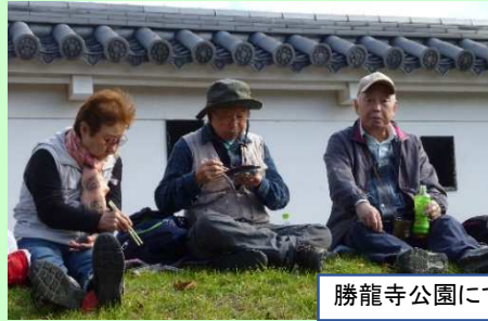
勝龍寺公園にて楽しい昼食タイム