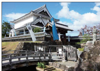
[勝龍寺城公園管理棟]

程でしたが、初参加の7名を含む49名の方に参加いただきました。まずは長岡京発見の地を訪ねた後、江戸時代の庶民信仰の対象になった六地藏・五王像がある神足石仏群を巡り、西国街道を南下し国の登録有形文化財で江戸時代の町家石田家に立ち寄りしました。その後、勝龍寺城の北端になる空堀を巡り、神足神社を訪ねた後、今回のハイライト明智光秀ゆかりの山城国勝龍寺城公園で昼食を摂りました。午後からは勝龍寺、春日神社、勝龍寺城大門跡と恵解山古墳を訪ね歩いた後、中山修一記念館、西光寺、明智光秀本陣跡を経て、阪急西山天王山駅にて散会しました。