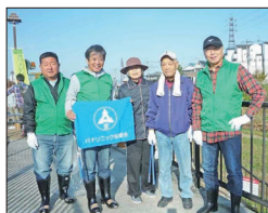
【川勝水辺広場参加の皆さん】

秋、爽やかな11月17日(日)、寝屋川市主催のクリーンリバーねや川作戦・秋が開催されました。清掃箇所