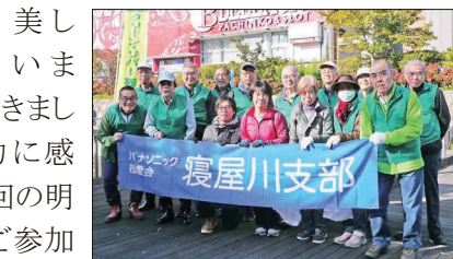
【せせらぎ公園参加の皆さん】

箇所には3名の合計29名の方のご参加をいただきました。約1時間半の草刈り、ゴミ拾いなどの清掃活動で、一汗流し、また一段と