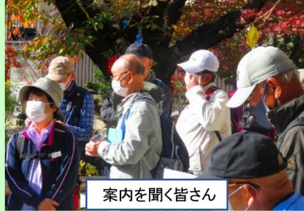
案内を聞く皆さん