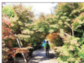
【真宗院 もみじの参道】

て、石造アーチ橋を渡り、西岸寺を後に名神高速道路の高架下沿いを歩き深草瓦町公園にて昼食を摂りました。昼食後は蓮如上人が当地を訪れた際に休憩した善福寺に立ち寄