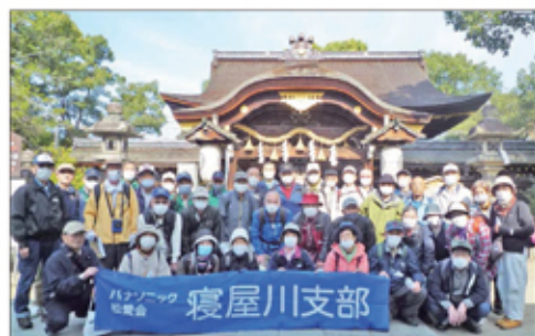
【勝運・学問と馬の神社 藤森神社にて】

り、持明院統派の12人の天皇が葬られている十二帝陵を訪ね、通称深草聖天で知られている嘉祥寺から日頃は門が閉まっていたが今回初めて境内に入れた真宗院へ、更に元政上人が竹を好んだ事から竹葉庵と言われる瑞光寺まで足を延ばし、次の宝塔寺では国の重要文化財である本堂・多宝塔・四脚門とともに7割色づいた紅葉を楽しんだ後集合写真を撮り、その後京都の名水の一つである「茶碗子の水」や「ぬりこべ地蔵」を散策し、深草の美しい空気を存分に味わいながら、散会としました。