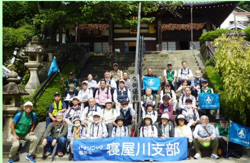
パナソニック 寝屋川支部