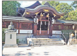
【陰陽師が祀られる清明神社】