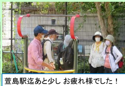
萱島駅あと少し お疲れ様でした!