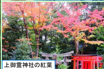
上御霊神社の紅葉