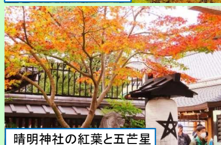
清明神社の紅葉と五芒星