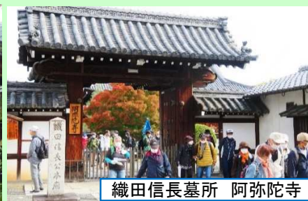
織田信長墓所 阿弥陀寺