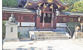
[紫式部墓・小野篁墓]

に見て、応仁の乱勃発地として知られる上御霊神社にて集合写真を撮り、薩長同盟締結地跡である小松帯刀寓居跡を後にし、