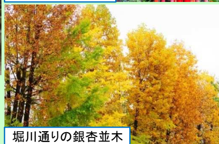
堀川通りの銀杏並木