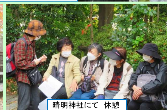
清明神社にて 休憩