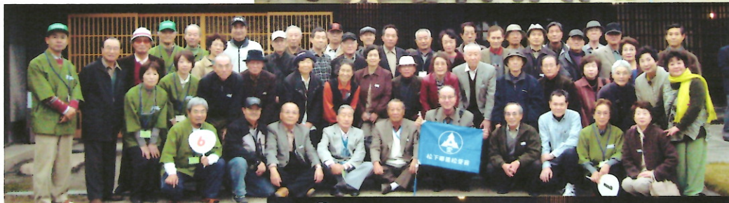
ボランティアの皆さん ありがとうございました