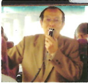
世話役 小島地区委員