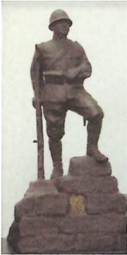
陸上自衛隊 伊丹駐屯地