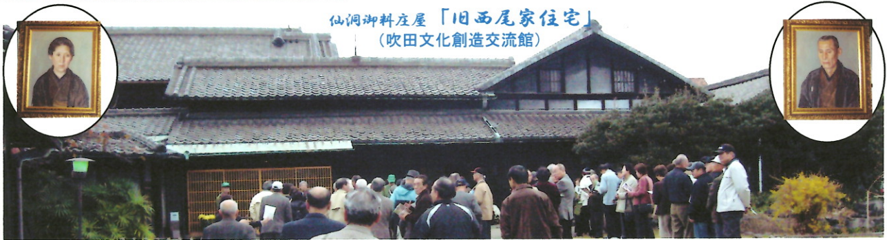
仙洞御料庄屋「旧西尾家住宅」 (吹田文化創造交流館)