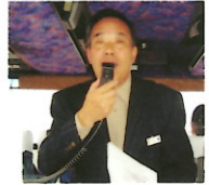
世話役 池澤地区委員