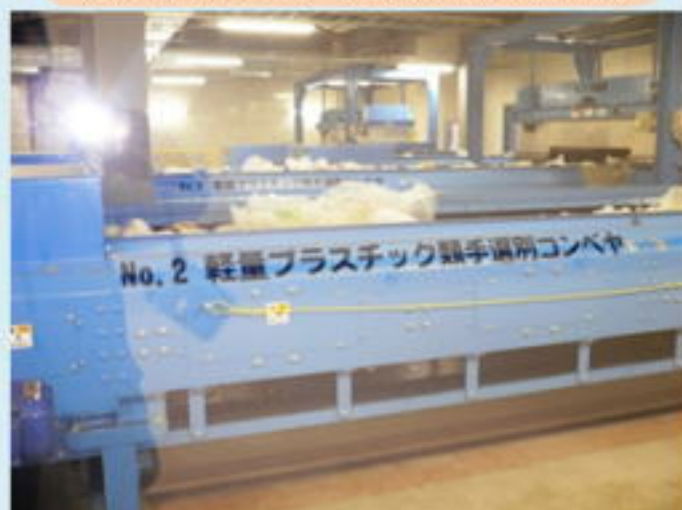
リサイクルセンター「かざぐるま」でペットボトル、軽量プラスチック選別、リサイクルの実態見学