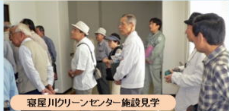
寝屋川クリーンセンター施設見学