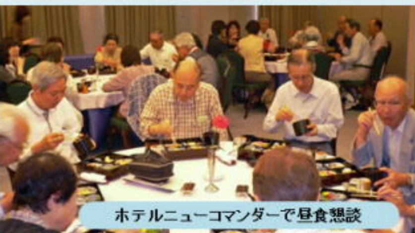
ホテルニューコマンダーで昼食懇談