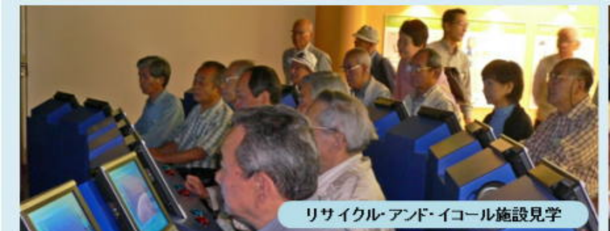
リサイクル・アンド・イコール施設見学