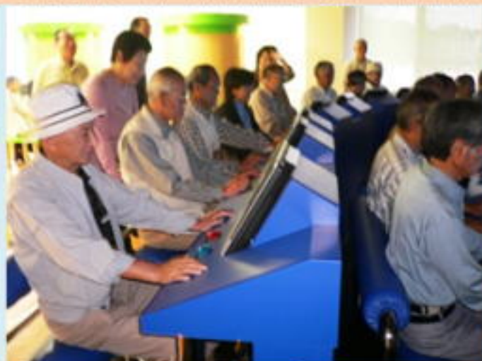
リサイクル・アンド・イコール社で体験