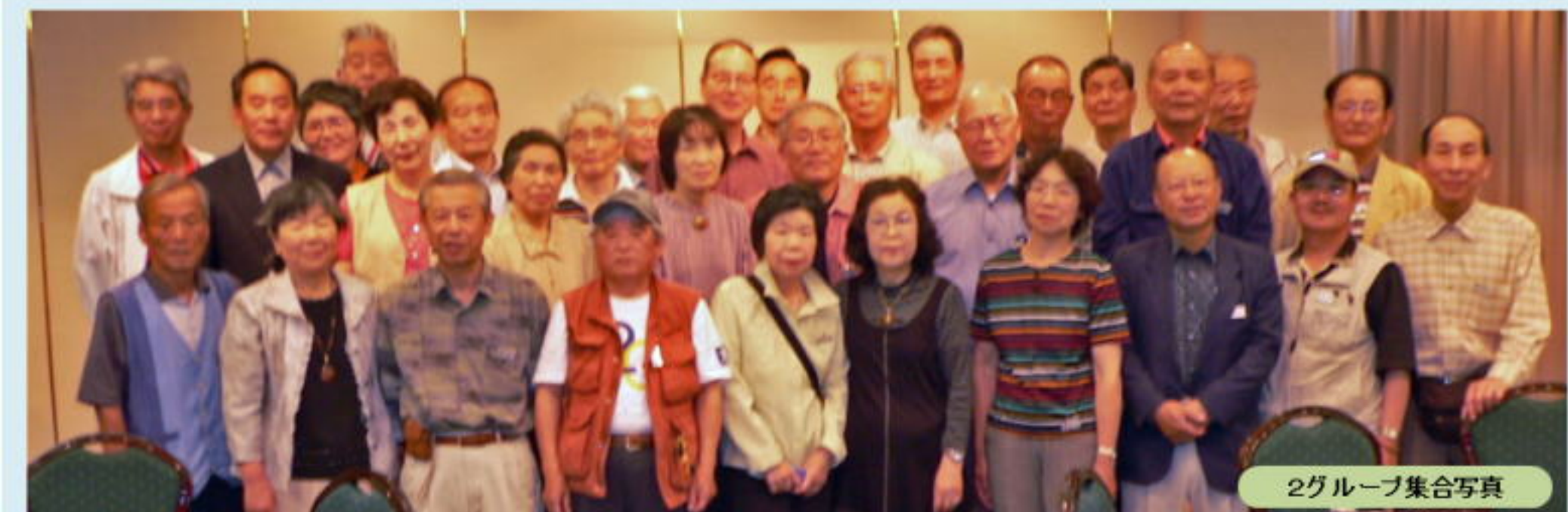
2グループ集合写真