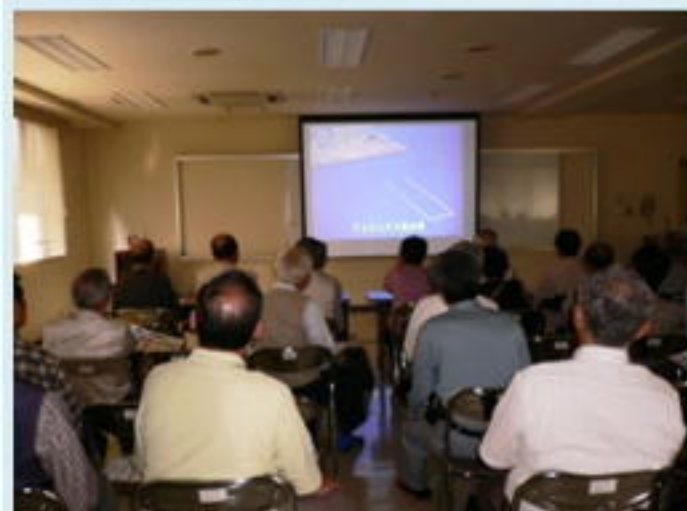
寝屋川クリーンセンター概要説明