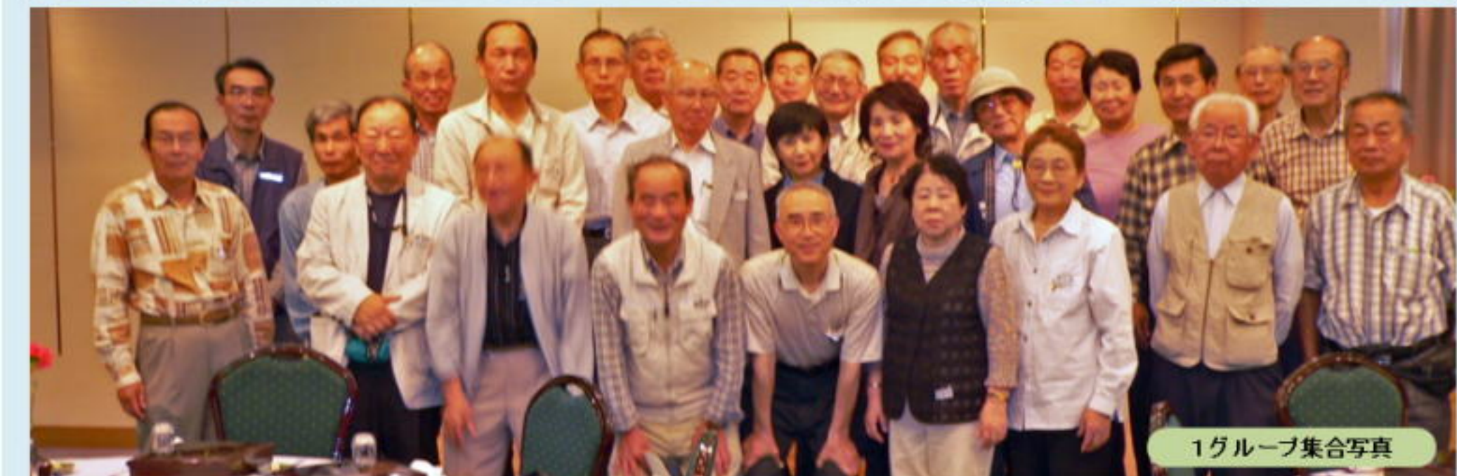
1グループ集合写真