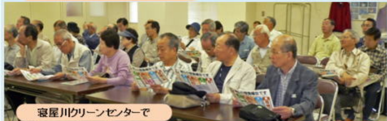
寝屋川クリーンセンターで