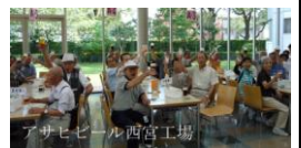
最高の盛り上がり で乾杯をしました

園内は花の手入れも行き届いており、職員の苦勞を感じた。昼食はきれいに咲き誇る花の下で、バイキング料理を堪能、満足し花鳥園を後にした。昼からは湊川神社に向かい、ご祭神である楠木正成公について宮司さんからお話を聞き大楠公の理解が深まった。その後西宮に移動十日えびすや開門福男選びで有名な西宮神社をお参りした。最後は全員が楽しみにしていたアサヒビール西宮工場の見学と試飲を楽ししみ、心地よい眠りの中無事に帰着した。