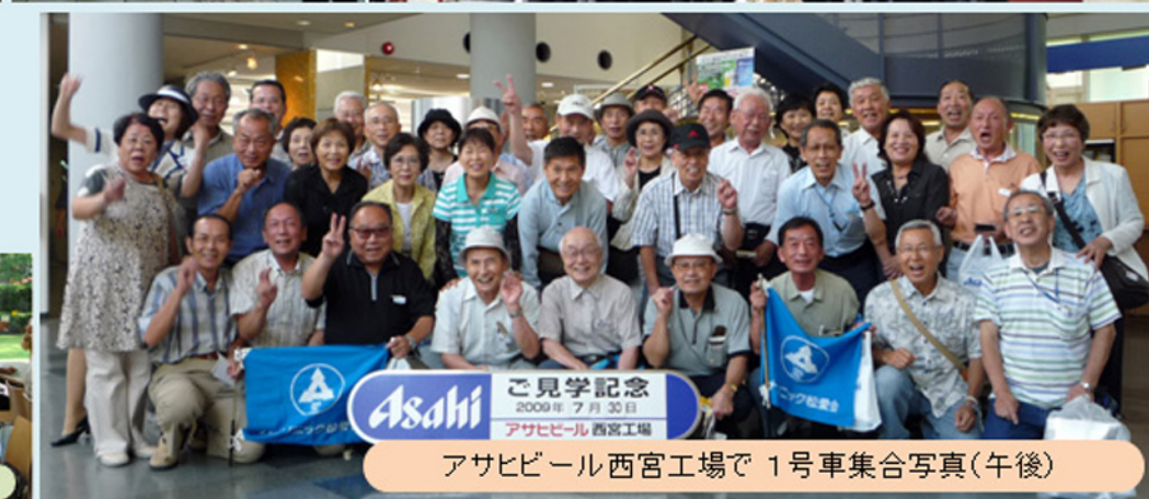
Asahi ご見学記念 2009年 7月 30日 アサヒビール 西宮工場