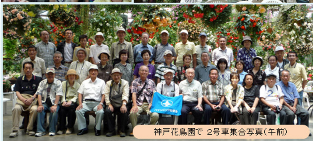
神戸花鳥園で 2号車集合写真(午前)