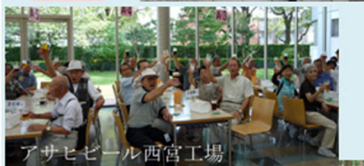
アサヒビール西宮工場