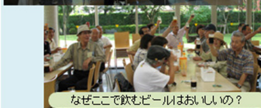
なぜここで飲むビールはおいしいの?