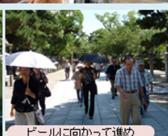
ビールに向かって進め