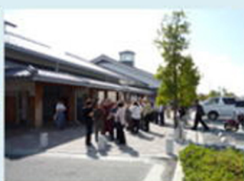
湖西道路道の駅/新旭町