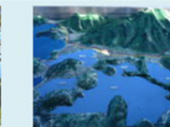
三方五湖解説地図拡大撮影