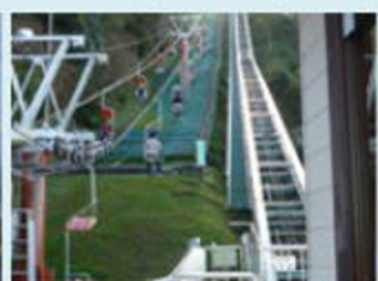
リフトとケーブルカー