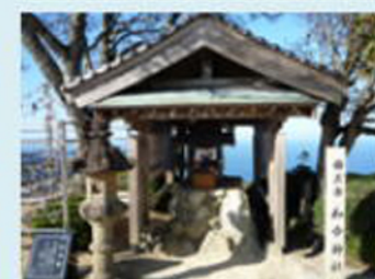
お孫さんも和合神社へ