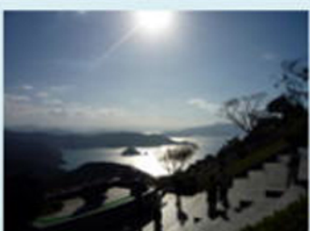
見事逆光を活かす 芸術！