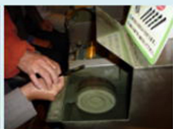
My箸遊び やっ怪しい手！