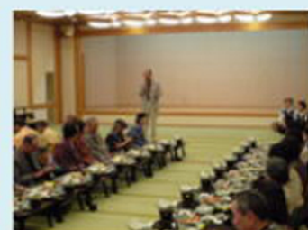
スゴイお料理満腹満福