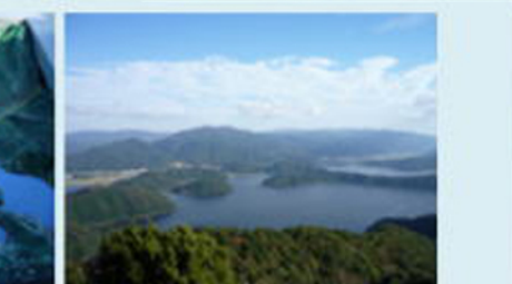
山上からの三方五湖