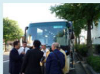
中国道事故渋滞！経路変更検討