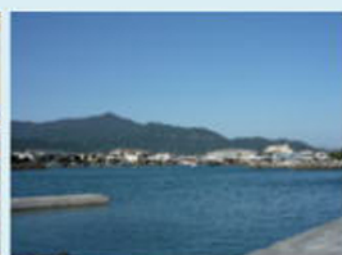
ホテルから見た小浜湾