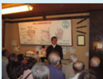
社長さんお話しまいね