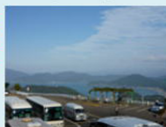
梅丈ヶ岳駐車場到着