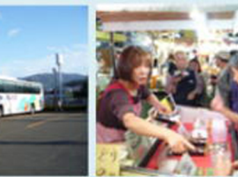
このおばちゃんの手前はどれも旨い！