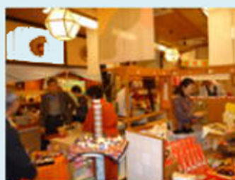
いろんな箸が沢山売れました バナソニックさんありがとう