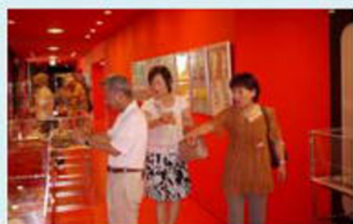
こんな人見たわ！青春の思い出