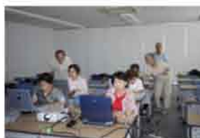
みんなが先生 教えあっています

支部には約870名の会員がいますがその中でeメールアドレスを持っている方が230名を超えています。ほぼ4人に1人がeメールを通して何らかの形でパソコンと向き合っています。その方々のパソコンの活用度はどのようなレベルなのでしようか?