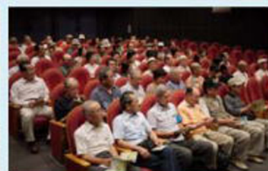
みんな熱心に聞きました