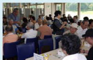
外は暑かったがビールは最高