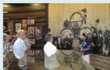
創業時のビール造りの説明