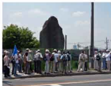
明治18年洪水碑の説明を聞く

京阪電鉄枚方公園駅に集合し、枚方市駅までの京阪線と淀川に囲まれた史跡16ヶ所を巡った。今回は江戸時代の京街道沿いの枚方宿の境界である西見附(守口側)く