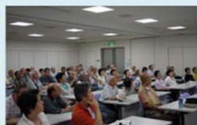
肥満は悪いのか？でも高齢者には！