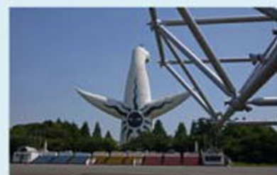
お祭り広場の名残