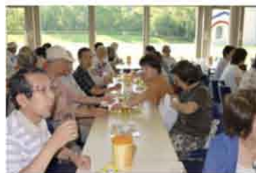
今回の楽しみはこれ!

最後に、当日の目玉にしていた人も多いアサヒビールの吹田工場見学と試飲で喉を潤おし、梅雨明け直後の猛暑日を吹き飛ばした一日でした。