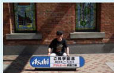
創業当時の工場外壁前で