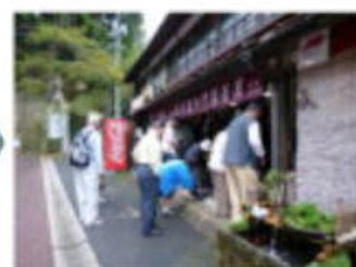
さあ食事だ 門脇茶屋へ