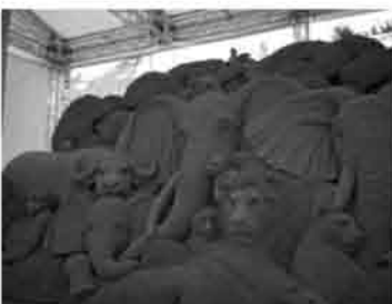
目が輝く砂の動物たち

最初の目的地は、帝釈天 摩尼寺はその参道の石段が三四段あり且つ急勾配です。それでも意気上がる支部会員は登り切り参拝しました。降りた時には息があがっていました。帝釈天に会えたかどうか定かではありません。素晴らしい筈の鐘の