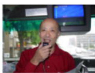
諸注意お願い 二号車 車長 宮田地区委員