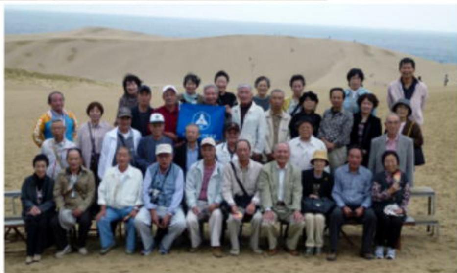
二号車 はくいパチッ