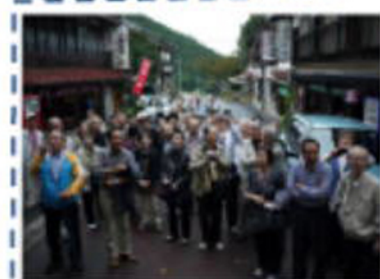
摩尼寺の急階段を見ながら説明を聞く