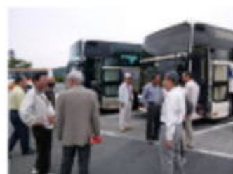
やれやれ オシッコ後 (加西SA)