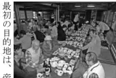
絶品の山菜料理を味わう

ご様子、各同好会・支部行事・ボランティア活動など地区の委員に気軽に声をかけていただき「寝屋川便り」を会員皆様に親しんで頂けます様、紙面の充実を目指していきますのでよろしくお願ひ致します。