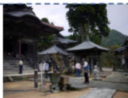
登りきれば平坦 帝釈天さまあへ