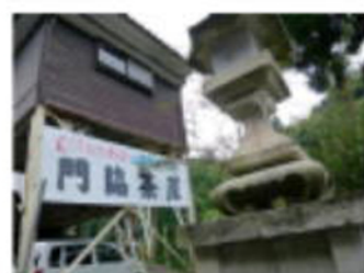
最初の目的地に到着 摩尼寺門前 門脇茶屋