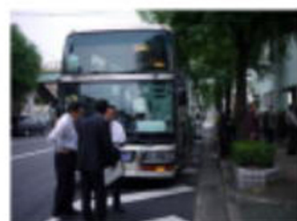
出発前運転手と 入念な打ち合わせ