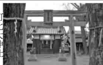
寝屋川市最南端にある神社