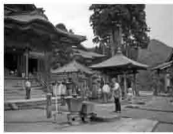
急段の後に参拝摩尼寺

次の目的地鳥取砂丘。砂の美術館の今年のテーマはアフリカ。既に来場者二十万人を突破したそうです。単なる穴なのに生きた眼の像やライオンの素晴らしさ!驚きです。