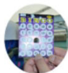
次がビンゴゲーム 各号車10名の 賞品が準備されています