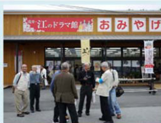
時間つぶしのおしゃべり