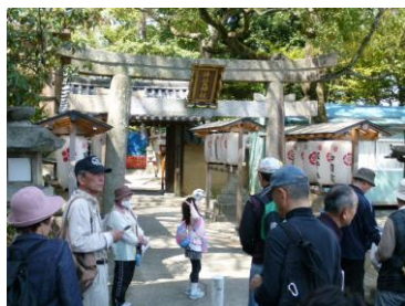
片埜神社東門付近

に初参加6名を含む44名十孫2名が集合し、枚方市内パート7のコースへと元気よく出発した。一日中天候に恵まれ、午前中は駅周辺の仏閣や遺跡、片埜神社等を巡った。片埜神社は河州一之宮の延喜式内社で、本殿は国の重要文化財、東門・南門・石造灯笼は府の文化財に指定されている。門には古い蛙股、灯笼には梵字が浮彫りされる等、河内地方の歴史や由緒が感じられた。