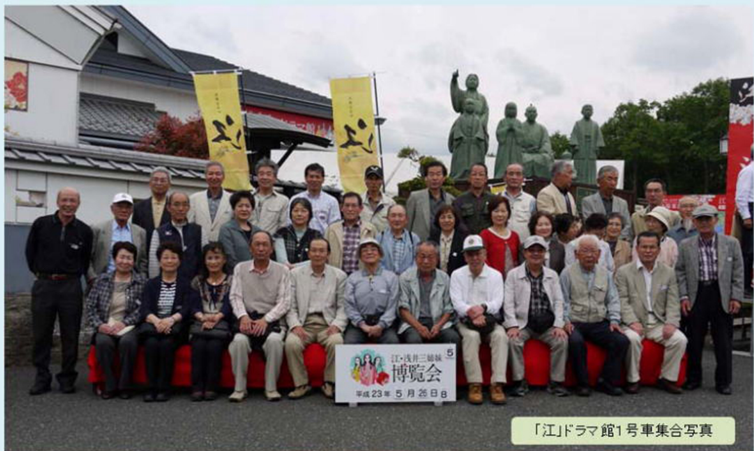
「江」ドラマ館1号車集合写真