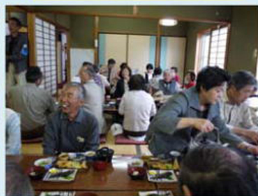
話もうまいが料理もうまい