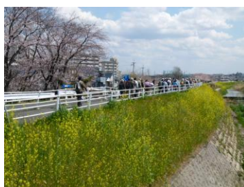
穂谷川三色空間の散策

菜の花の黄、桜のピンク、晴天の青の三色に囲まれた空間の中を、心地よい春風を受けながらのんびりとした散策となった。