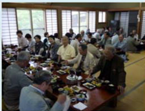
鯉の刺身酢の甘露煮等々