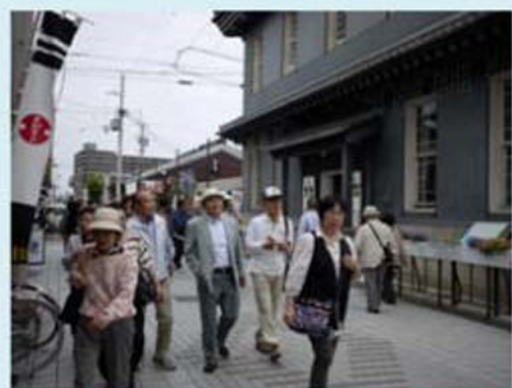
長浜黒壁地区散策