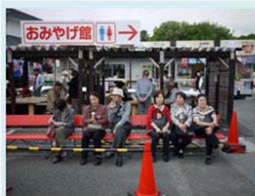
見学疲れて一休み