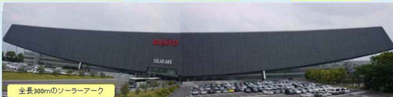
全長300mのソーラーアーク