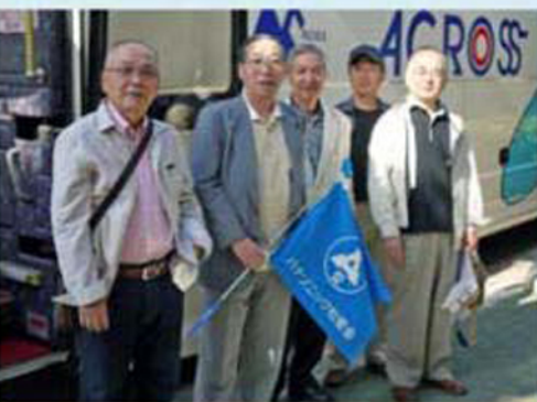
全員集合 役員さんご苦労様です