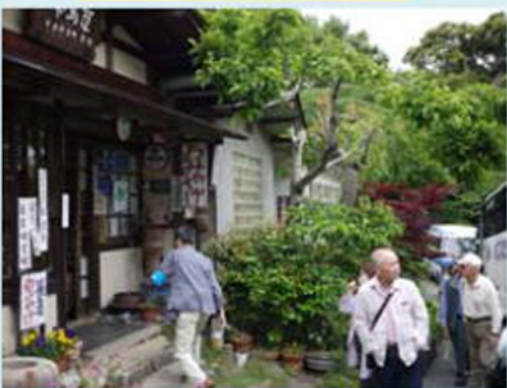
明治13年創業豆馬亭