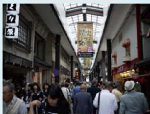
グループに乗ってにぎやか