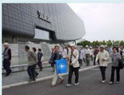
ソーラークの見学