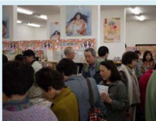
いくら買っても終わらない