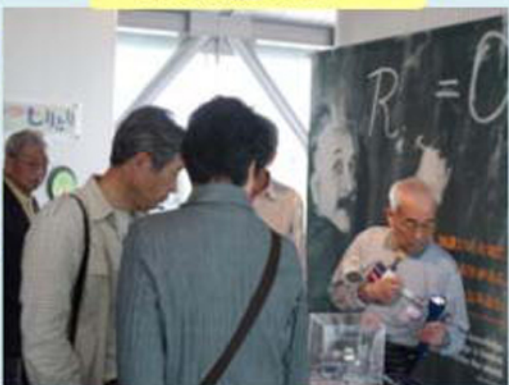
アインシュタインと知恵比べ