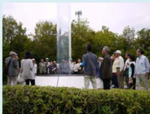
なかなか面白いな