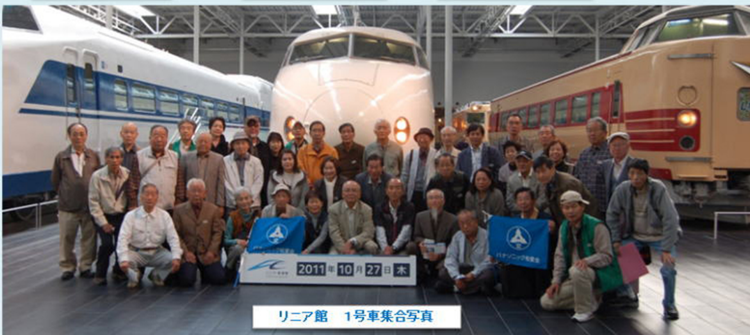
リニア館 1号車集合写真