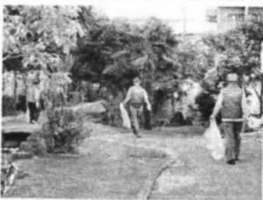
ユニフォームを着用し活動

活動促進制度」が設けられ、支部活動への支援が得られる事になった。当支部は活動の知名度が上がるように、ウインドウブレイカーを作成することを申請し、承認を得た。支部行事に着用し活動を認知していただくことを進めている。11月20日には寝屋川市より13年間に及ぶ「美化ボランティア」が認められ美しいまちづくり表彰を受け今後の励みになった。