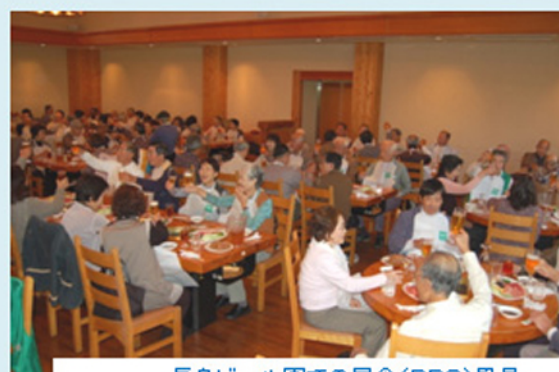
長島ビール園での昼食(BBQ)風景 ビールで乾杯！！