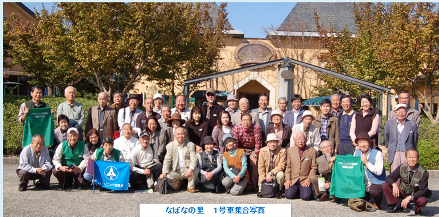
なばなの里 1号車集合写真