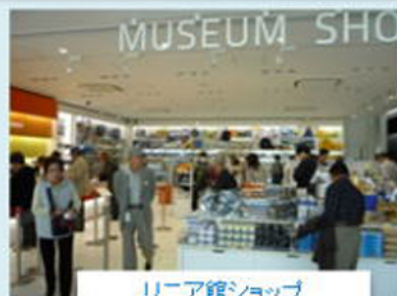
リニア館ショップ