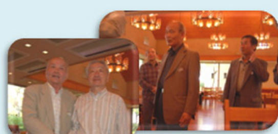
クイズ・ゲームの代表表彰(賞品総数50)