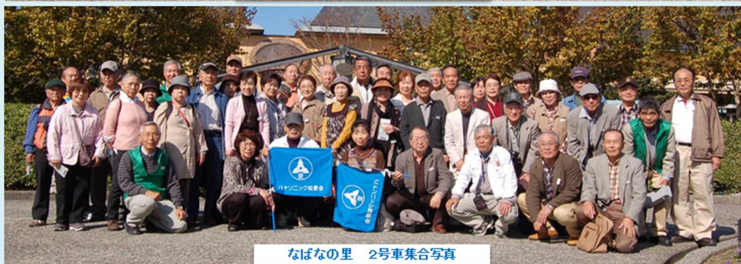
なばなの里 2号車集合写真