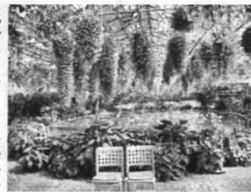
ペゴニアガーデン

「咲いているのに花の臭いが気にならない」と話していると係の方から、「ペゴニアは香りが少ないので、眼で楽しんで貰えれば」との話を聴き、なるほどと納得した場面もありました。 次に向かったのは花ひろばでした。コスモスや