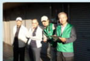
世話役ご苦労様です 1号車長 南場地区委員 2号車長 上山地区委員