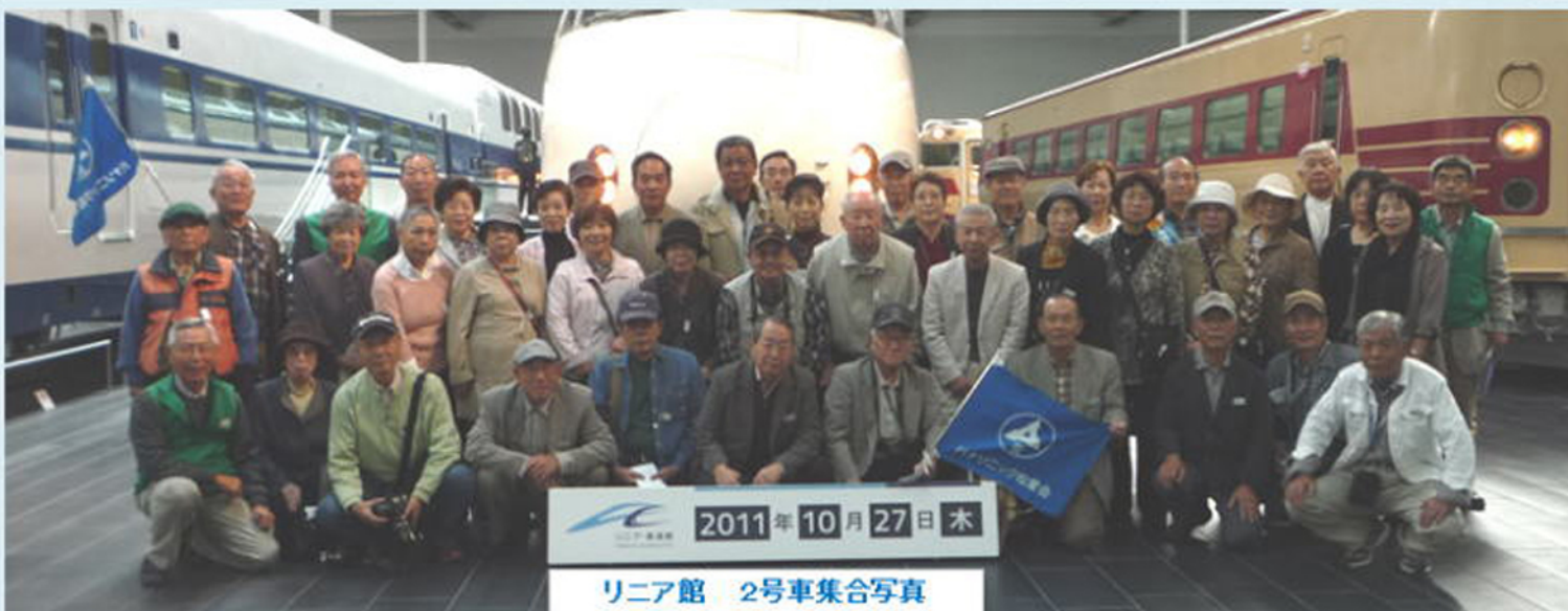
リニア館 2号車集合写真