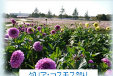
ダリア・コスモス祭り