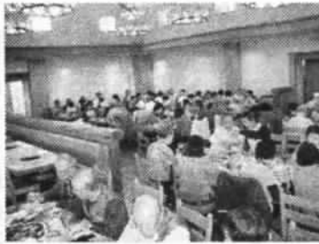
地ビール付きの昼食