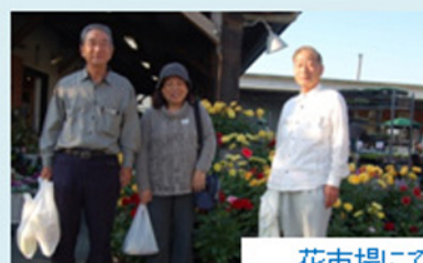
花市場にて買物と休憩の皆さん