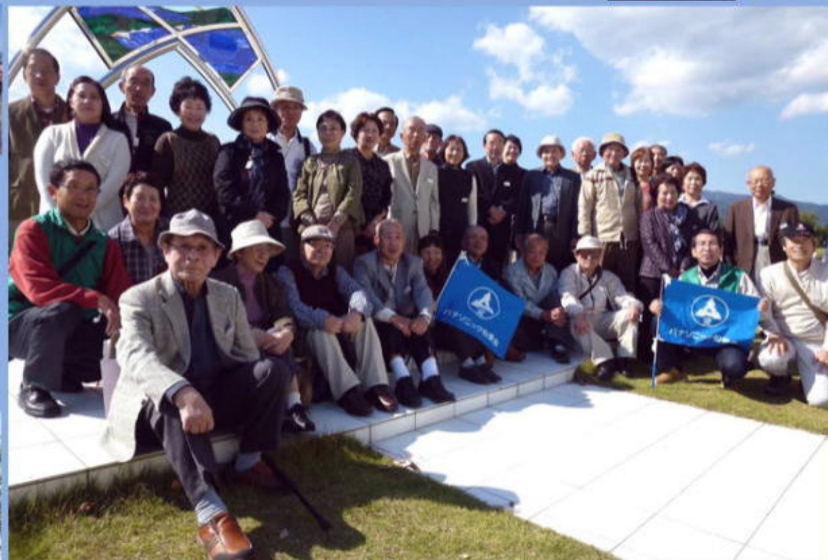
天橋立ロイヤルホテルガーデンにて記念撮影2号車の皆さん