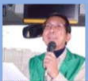
西山・上山地区委員