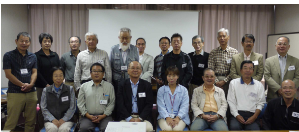
第1回「樹を植えよう」参加の皆さん

当日の講演会を終えて 社会貢献活動の一環とし ては環境問題等を考えた ときには必要な事と思っ ますとともに、ボランティア 活動のきっかけづくり、健 康づくりの仲間を広げる 活動に期待している等多 くのご意見、感想いただき ました。次々回三月三日 (日)の第三回目の開催へ の参加をお待ちしており ます。