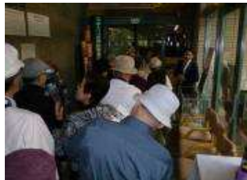
坂井氏の活動を学芸員から

えよう!」を計画しており ます。 その第一回目は「ねやが わの生物多様性」の講演会