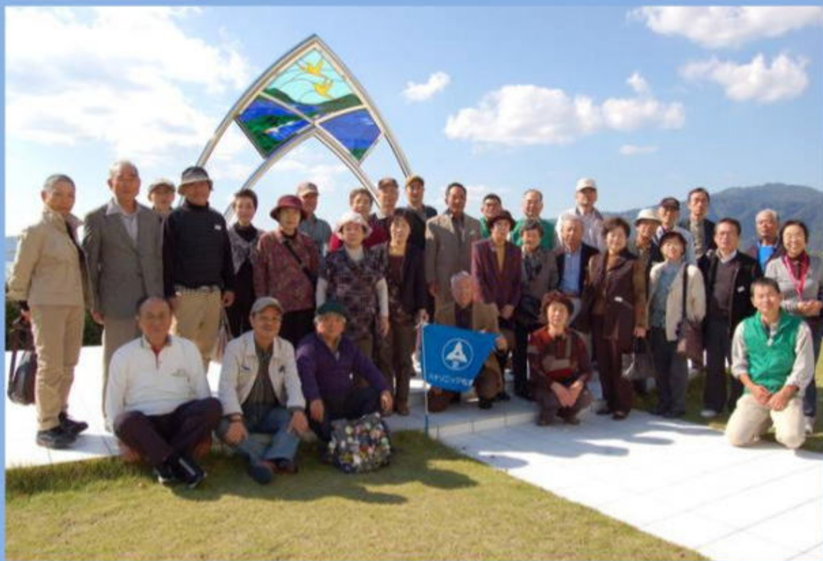
天橋立ロイヤルホテルガーデンにて記念撮影1号車の皆さん