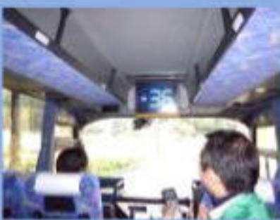
バス内でのピンゴ