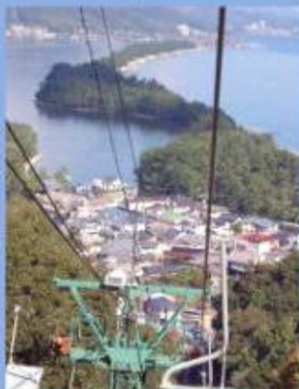
リフトからの風景