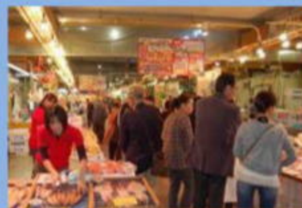
舞鶴とれとれセンター