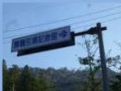
舞鶴引揚記念館へ