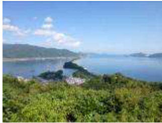
股視きからの眺望

境内の松林等を見 し、昼食の「宮津ロイヤ ルホテル」へ移動しまし た。この庭園で記念写真 をとりました。その際、